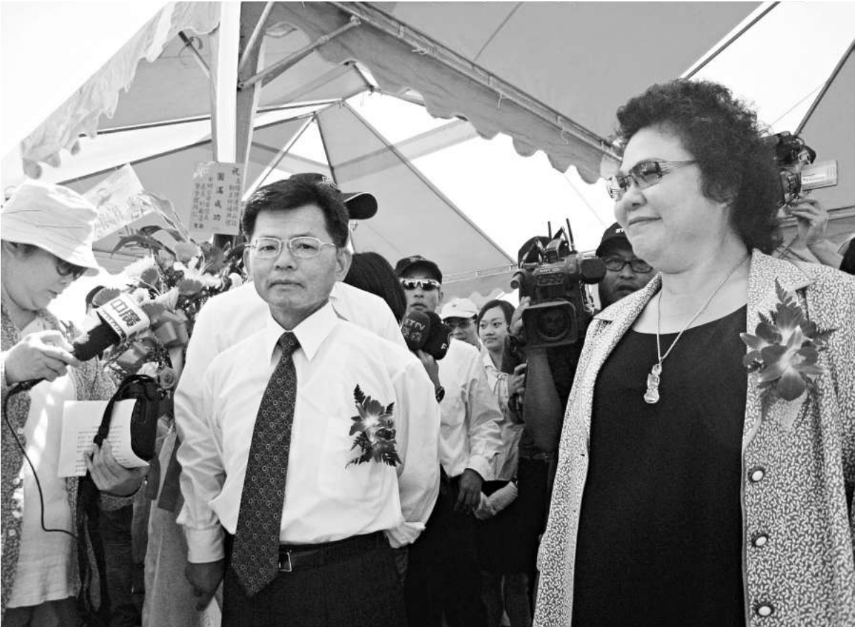
▲高雄縣長楊秋興（左）及高雄市長陳菊（右）月初在一活動中相遇，對於媒體詢問是否完成整合，他們都以「謝謝」回應。資料圖片

據了解，高雄地方一直都有楊秋興脫黨參選的傳聞，甚至有幹部召集開會，討論選舉事宜。民進黨發言人蔡其昌表示，黨中央一直都與楊秋興保持通暢的聯繫管道，依照他們溝通的狀況，「我們對楊秋興有信心，也