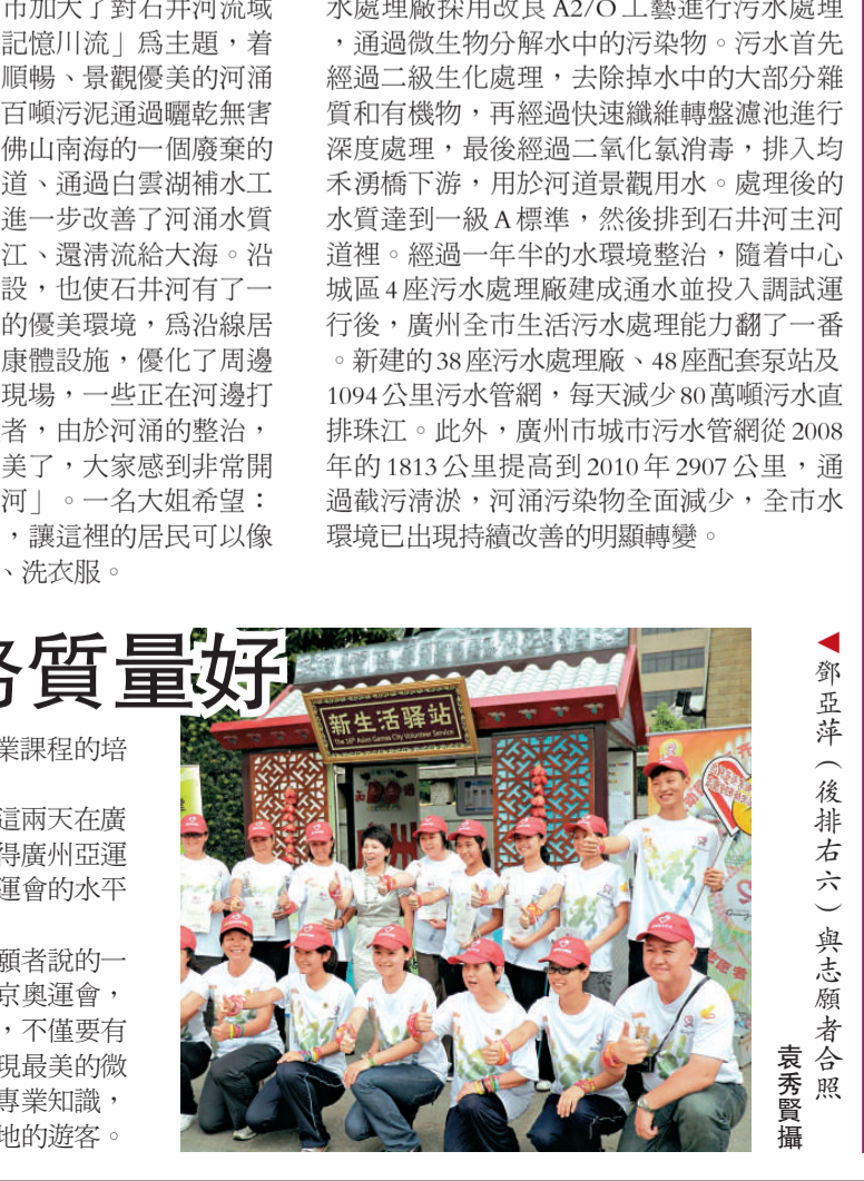
鄧亞萍(後排右六)與志願者合照。

【本報記者袁秀賢廣州二十九日電】為期三天的亞運志願者領袖國際交流營，日前在廣州志願者學院實訓基地降下了帷幕，奧運冠軍鄧亞萍、舉重冠軍陳燮霞、北京殘奧會賽艇TA級冠軍周楊靜等出席。鄧亞萍接受記者採訪時表示，廣州亞運會的志願服務既繼承了奧運會的成功經驗，也有廣州這座城市獨具的嶺南特色，廣州亞運會的志願服務質量一定能達到奧運會的水平，甚至比奧運會做得更好。 此次交流營邀請多名國際志願服務專家以及北京奧運會志願服務專家，對廣州亞運會100多名志願者領袖進行了專業課程的培訓。 鄧亞萍在閉營儀式上表示，這兩天在廣州與亞運志願者們接觸交流，覺得廣州亞運會的志願服務質量一定能達到奧運會的水平，甚至比奧運會做得更好。 當被問及最想做廣州亞運志願者說的一句話，鄧亞萍笑着說，經歷過北京奧運會，最大的感受就是作為一名志願者，不僅要有志願服務熱情，在服務過程中展現最美的微笑，更重要的是要把自己所學專業知識，盡自己最大所能幫助來自世界各地的遊客。