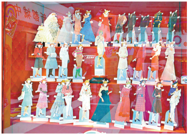
▲戴安娜王妃換衫公仔紙共有二十多套經典服裝 本報攝