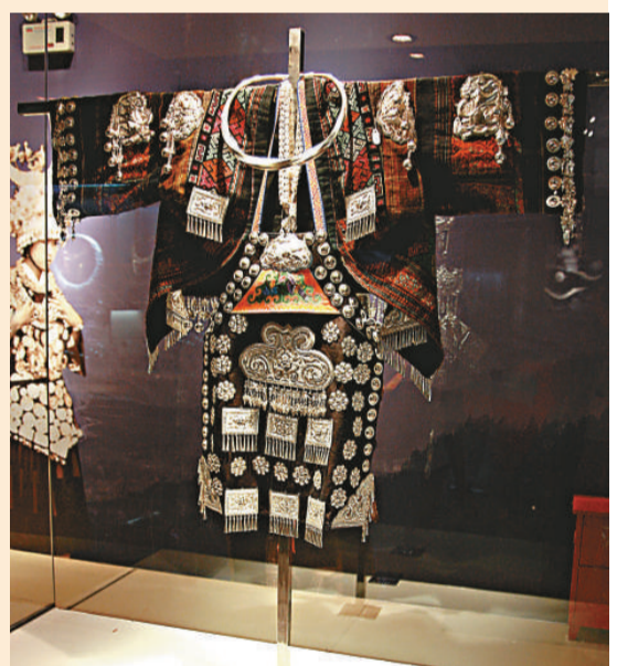
此次展覽展出的貴州苗族銀飾——銀風冠 本報攝