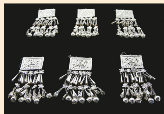
▲苗族裝飾在衣服上的銀衣片 本報攝 ▲相傳苗族銀飾可驅邪去病 本報攝

由於對銀飾的大量需求，苗族銀匠業極為興旺發達。僅黔東南境內，以家庭為作坊的銀匠戶便成百上千，從事過銀飾加工的人更是多