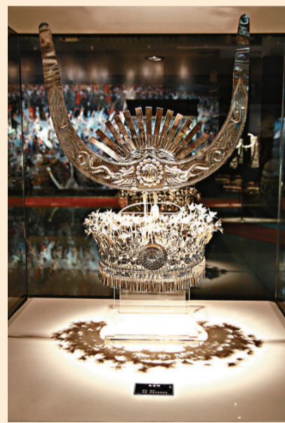
華美的苗族服飾