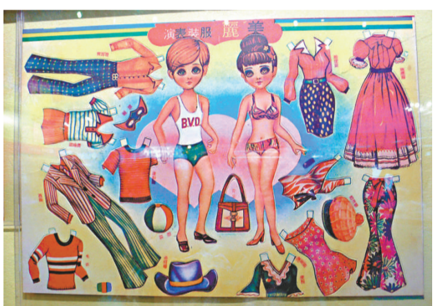
▲這些換衫公仔紙上的喇叭褲，反映了七十年代的時裝潮流