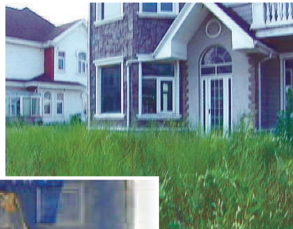
▲北京衛星城住宅多空置，浪費大量社會資源

像這樣的大面積空置房在全國到底有多少？記者諮詢了住房與城鄉建設部，房產協會、國家電網以及自來