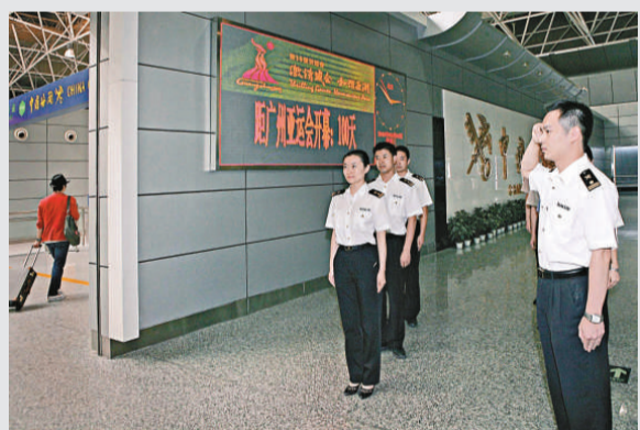
▲廣州天河車站口岸海關關員誓師迎亞運

廣州天河車站口岸是亞運會的主要陸路通關口岸，據預計，亞運會期間該口岸日均進出境人數將達到1.2萬人次。為此，天河車站海關近期將接連開展一系列的亞運通關演練，內容包括如何應對反恐、核生化物品進境、火災等突發事件，以着力打造口岸平安亞運工程。同時，還將在現場開設亞運通關專道，加強禮儀培訓，為亞運大家庭成員及其物資提供優質通關服務。