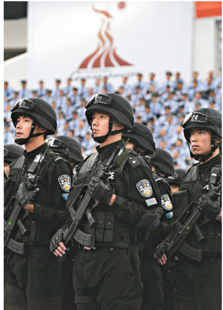
▲廣州亞運安保工作誓師大會舉行現場