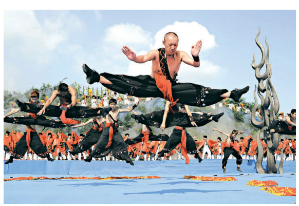
▲在火把節開幕儀式上，演員在表演傳統彝族功夫舞蹈

今早，數千名身著節日盛裝的當地群眾載歌載舞，拉開了第六屆中國涼山彝族國際火把節的序幕。開幕式