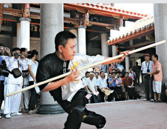
▲武術愛好者在白鶴拳文化節活動上表演