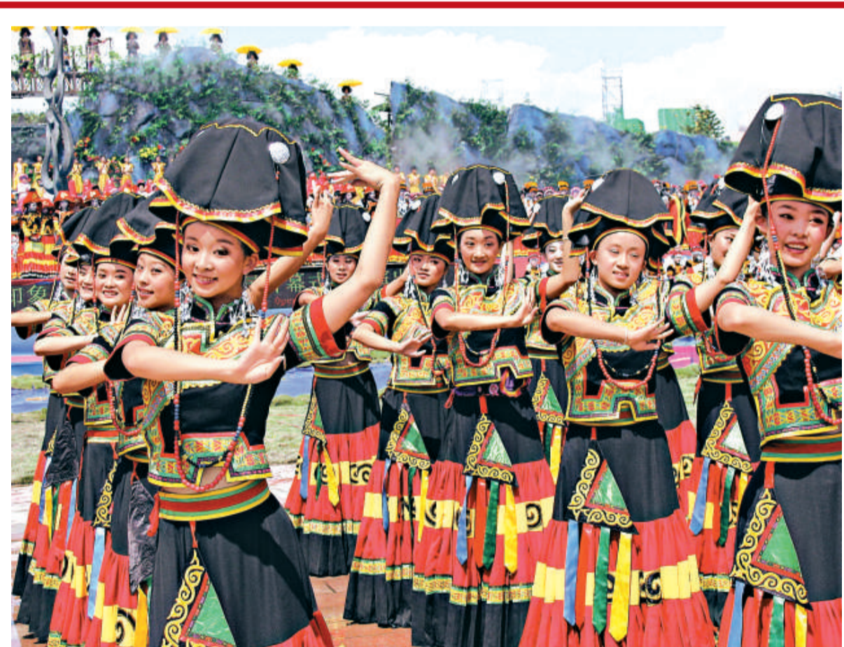
▲在涼山彝族火把節的開幕儀式上，彝族姑娘翩翩起舞