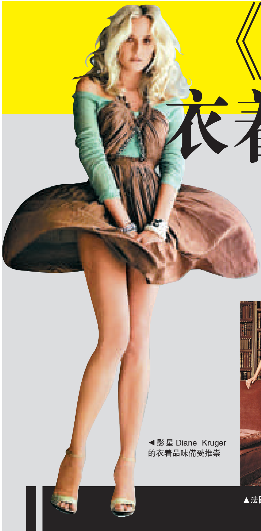
◀影星 Diane Kruger 的衣着品味備受推崇

【本報訊】綜合外電3日消息：老牌時尚雜誌《名利場》（Vanity Fair）在最新一期中公布其國際最佳衣着人士名單／國際最佳衣着人士榜，惹人矚目的上榜者，除了形象百變的女歌手Lady Gaga，還有美英法三國的「第一夫人」。薩曼莎·卡梅倫當上首相夫人不久，已為丈夫爭了光，成為了史上首位入選《名利場》衣着榜的孕婦。