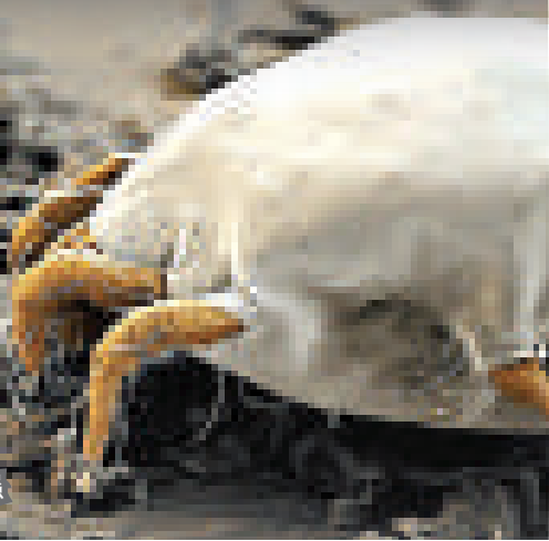
▶以人類死皮為食的蠅蠅