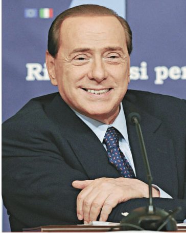
▲意大利總理貝盧斯科尼再次受桃色醜聞困擾