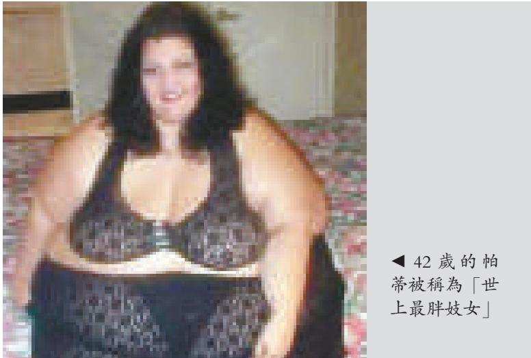
◀42歲的帕蒂蒂被稱為「世上最胖妓女」