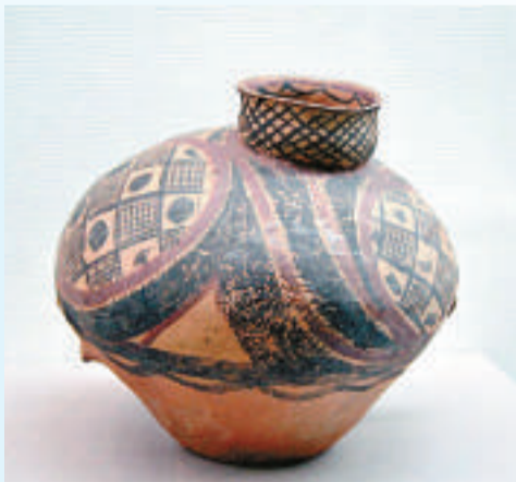
▲圓圈網紋及圓點紋鳥形壺 ▲刻畫「7」寬帶紋彩陶鉢

此次展出的弦紋雙體動物紋雙耳彩陶豆是馬家窯文化早期的代表，彩陶豆高十三厘米，口徑二十四厘米，底徑十三點一厘米，翻唇、平底、圈足，腹部有雙耳，由紅褐色、黑、白彩繪製，色彩較先時期更豐富。紋飾繪有弦紋和動物紋。當時馬家窯文化時的符號。