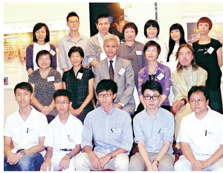
▲「陶瓷茶具創作比賽」得獎者及嘉賓大合照

「陶瓷茶具創作展覽二〇一〇」現時至二〇一一年五月十六日在香港公園內的茶具文物館舉行。前日擔任開幕禮主禮嘉賓的包括有康樂及文化事務署助理署長（文物及博物館）吳志華、香港藝術館總館長鄧海超及三位評選委員李慧嫻、馬素梅及嚴惠慈。