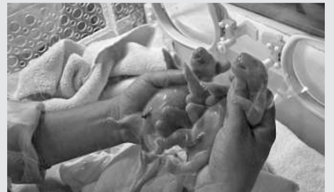
▲成都大熊貓「奇珍」產下的熊貓龍鳳胎寶寶

四川成都大熊貓繁育研究基地的大熊貓「奇珍」6日誕下了今年首對大熊貓龍鳳胎，第一隻寶寶為雌性，體重153克，第二隻寶寶為雄性，體重149克。目前，龍鳳胎均身體健康。