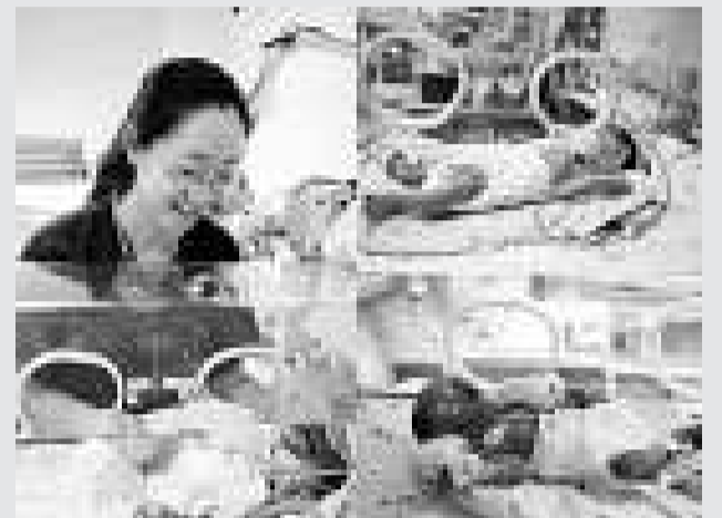
▲主治醫生及早產的三胞胎姐妹

上海兒童醫學中心透露，該院日前接診總體重僅三公斤的三胞胎姐妹，平均每人僅重一公斤，大大低於正常足月生產嬰兒六斤的體重，孩子於7月27日出生後，由於未足月生產，立即被轉到該中心新生兒重症監護室。