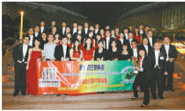
▲香港節日管樂團凱旋

香港節日管樂團於一九九五年一月成立，目的是透過有系統的訓練、演出及其他外展活動，推廣當代管樂音樂、推動香港本土創作及培育本港年輕管樂及敲擊樂演奏者。該團經常舉辦不同形式的音樂會，帶領觀眾認識管樂團及管樂作品。成立至今，已演出超過一百場音樂會。近年該團經常與著名演奏家、歌唱家、合唱團及樂團合作演出，亦多次委約及首演本港新一代之管樂作品，致力推動本土管樂文化。該團經常獲邀往外地演出，足跡遍及法國、澳洲、日本、韓國、新加坡、台灣及澳門等。