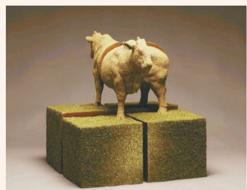
▲劉有權創造了一隻身上長草的牛