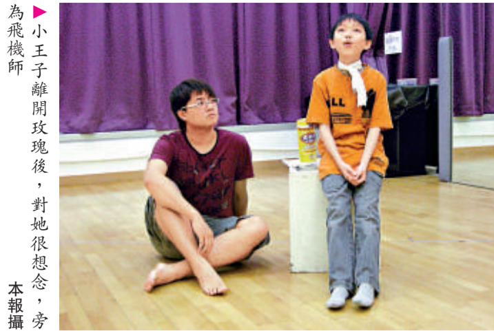
為飛機師 小王子離開玫瑰後，對她很想念，旁