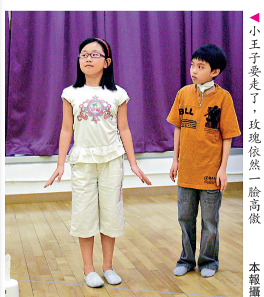
▲小王子要走了，玫瑰依然一臉高傲