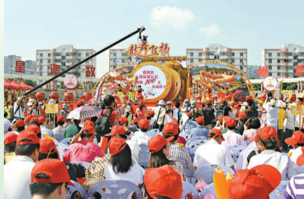
▲「鼓舞飛揚」——百日迎亞運儀式現場

「亞運會令番禺面貌發生了很大變化，身為番禺人感到非常高興。適值亞運會倒計時一百天，參加攝影採風活動，用相機記錄精彩瞬間，留下美好回憶。」一名番禺攝影愛好者高興地對記者說。