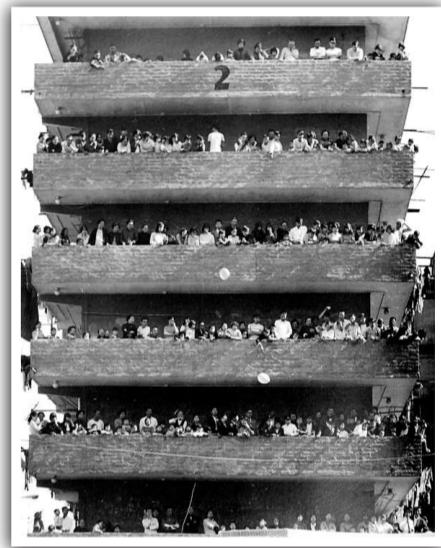
▲每棟徙置大廈就是一個小社區