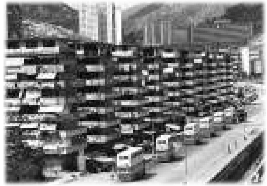
▲徙置大廈在上世紀五十年代出現

第二次世界大戰結束後，大批在戰時逃返故鄉的香港居民重回家園，他們面對頹垣敗瓦、無處容身的窘境，只能在市區邊緣，搭建或租住簡陋的寮屋棲身。這些僑建的寮屋，初時在市郊疏落地出現，後來沿着山勢慢慢地擴展開去。據統計，一九四九年香港的二百萬人口中，就有三十萬人住在寮屋內。