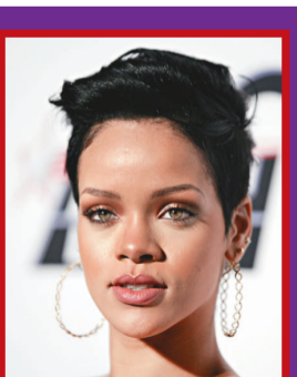
▲ Rihanna 希望為老友搞一個難忘的婚前派對

現時在樂壇呼風喚雨的前衛女歌手 Lady Gaga，每次演出均令觀眾有所期盼，的確唔簡單。未知她進軍影壇，效果可會同樣震撼？有消息指，Gaga 有意開展電影事業，而《非常嫌疑犯》(The Usual Suspects) 導演白賴仁辛格 (Bryan Singer) 有可能掌舵 Gaga 在影壇的處女作。