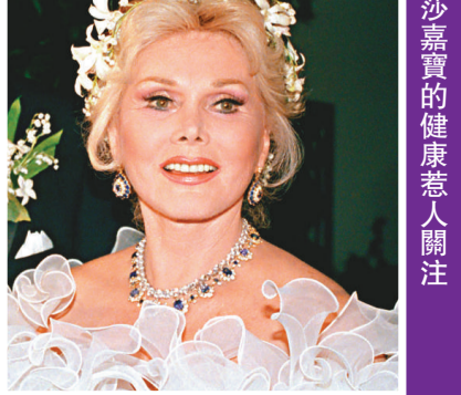
▲莎莎嘉寶的健康惹人關注