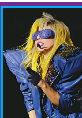
▲ Gaga 有意進軍影壇