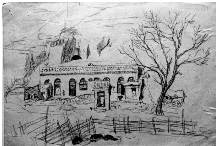
蘇高禮《家鄉一景》（一九五九年） 本報攝