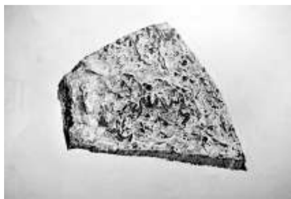
徐冰《瞬間》（一九八八年）

此次展覽已在北京、廣東、武漢展出，引起了熱烈的反響，之後還將前往西安和南京，而在二〇一四年，將在英國維多利亞博物館展出。據悉，如果檔期和場館合適，中央美院亦有在港辦展的打算。