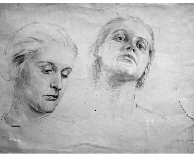
林山《人物頭像》（一九五四年於列賓美術學院）