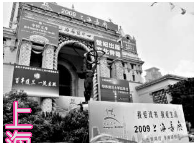
上海書展已成為內地最大圖書盛事，圖為去年上海書展的宣傳廣告。