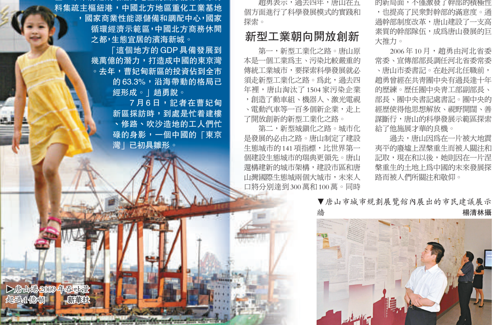
▷唐山港2009年吞吐量超過1億噸

唐山市進行的幹部選拔制度改革走在了全國的前列，因此受到邀請，在全國幹部制度改革經驗交流會上介紹了經驗。