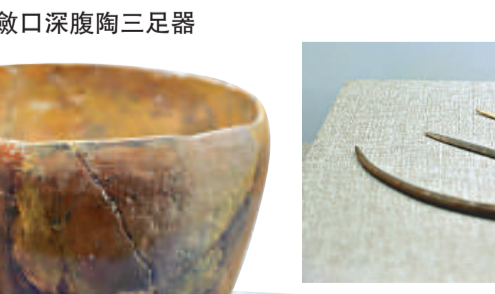
▼斂口深腹陶三足器