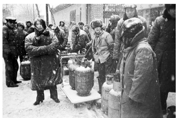
▲人們在嚴寒中等待換熱氣罐。內地攝影師賀延光攝於一九八七年