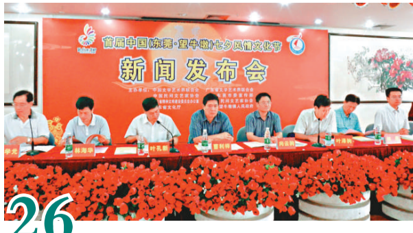
▲七夕文化節新聞發布會現場