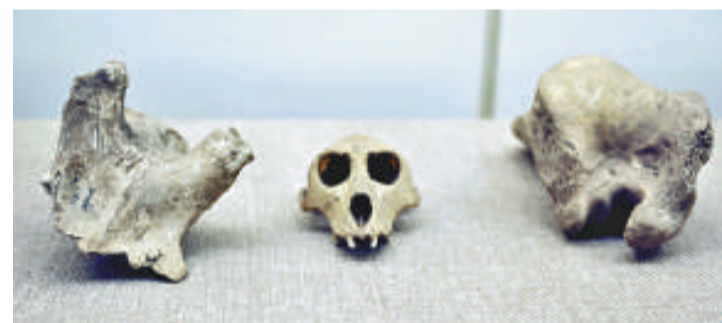
▲左起：鹿頭骨、獼猴頭骨、牛骨

「全國重點網絡媒體河北行」採訪團日前參觀了邯鄲市博物館，館內正展出磁山文化時期的文物，堪稱經典，讓大眾感受到八千多年前那一幅幅刀耕火種、漁獵採集的原始生活場景。