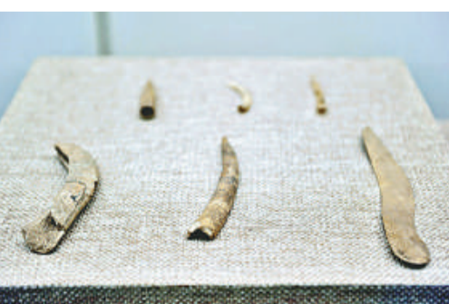
▲扁平彎角骨梭和骨匕

以石質斧、鏟、磨盤、磨棒為特點的農耕和脫粒工具，以陶、石器「組合物」為特點的祭祀遺址等，構成了磁山文化獨特而豐富的內涵。磁山文化是中國新石器時代考古的一項重大突破。