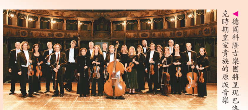
▲德國科隆古樂團將呈現巴洛克時期皇室貴族的原版音樂

到目前為止，樂團已經錄製了五十多張碟片，包攬無數唱片大獎，如格萊美獎、回聲、德國金唱片獎、法國音樂獎、音叉獎、金音叉獎等。