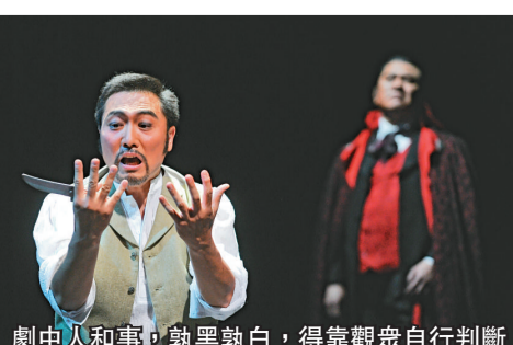
劇中人和事，孰黑孰白，得靠觀眾自行判斷