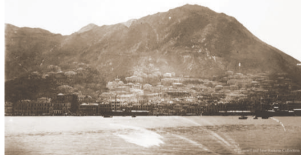
▲一八八八年的維多利亞港