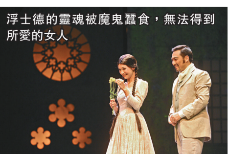
浮士德的靈魂被魔鬼蠶食，無法得到所愛的女人