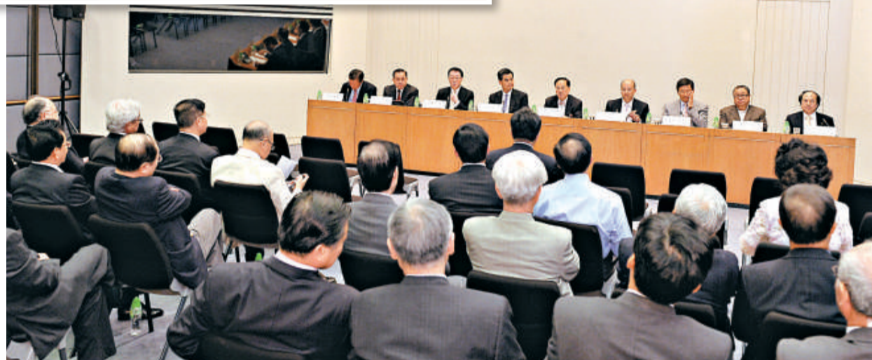
▲曾蔭權昨日下午在中區政府合署會見港區全國政協委員，諮詢施政意見

有與會的人大代表透露，曾蔭權在會上表示感謝各界支持政改方案，而在政改方案獲通過後，政府施政會着重回應社會對民生、經濟等方面的訴求。多位人大代表建議