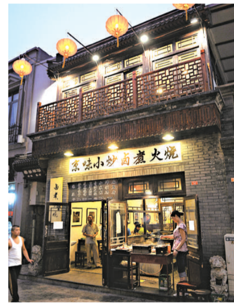
▲在大柵欄商業街，「京味小炒燉煮火燒」店舖生意火爆