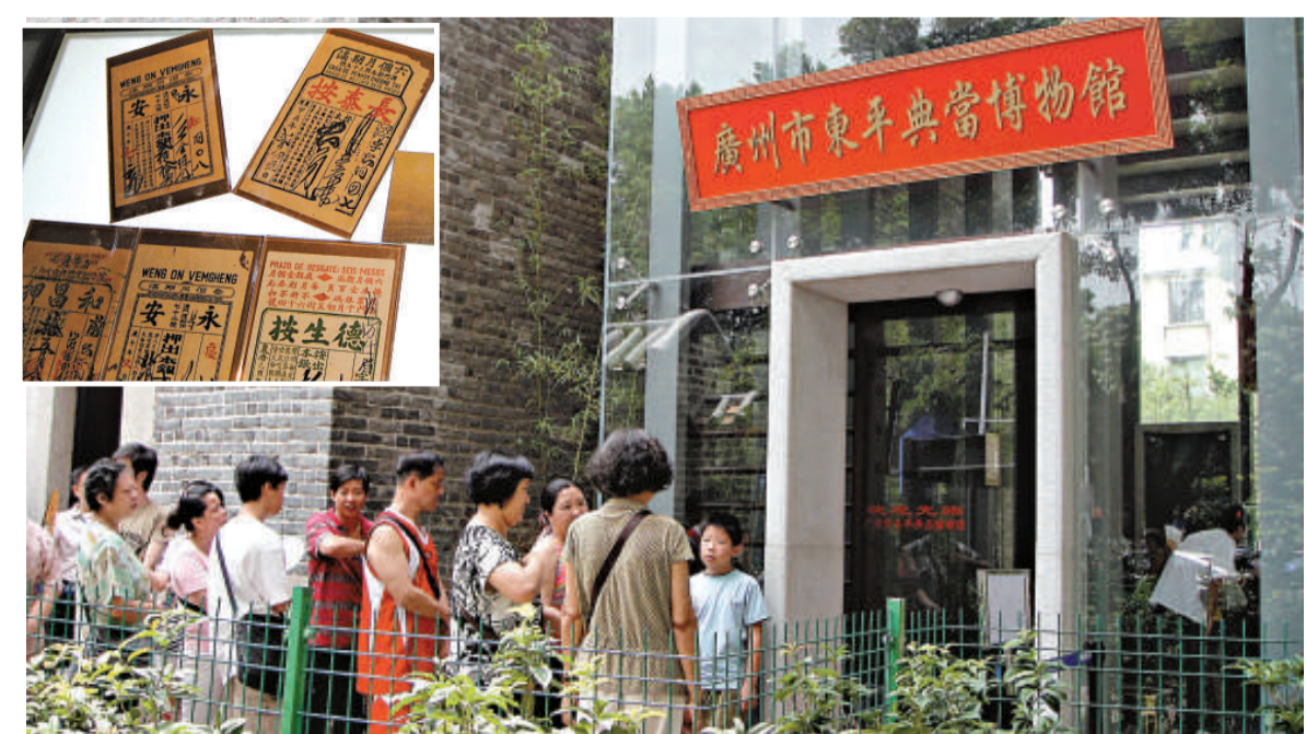
▲市民排長龍等候入博物館參觀。小圖為當年港澳地區的當票

現年74歲白髮蒼蒼的許婆婆，排隊近一個小時才進內參觀，雖是耄耋之年，依然神采奕奕，絲毫不見倦意。「典當舖是童年時的一個回憶，那時進去裡面