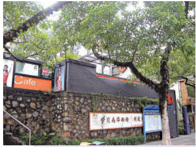
▲建設六馬路到處是優閒的咖啡店，這裡早已被貼上小資標籤的商業街，在樹蔭下喝咖啡，充滿外國浪漫情調

【本報訊】在近期進行的「共迎亞運，感受廣州——廣州十大特色街道評選」中，有着城中「小資街」之稱的廣州建設六馬路當選最具特色的街道之一，一些外國友人接受記者採訪時表示，這條「小資街」也是他們感覺最親切的街道。