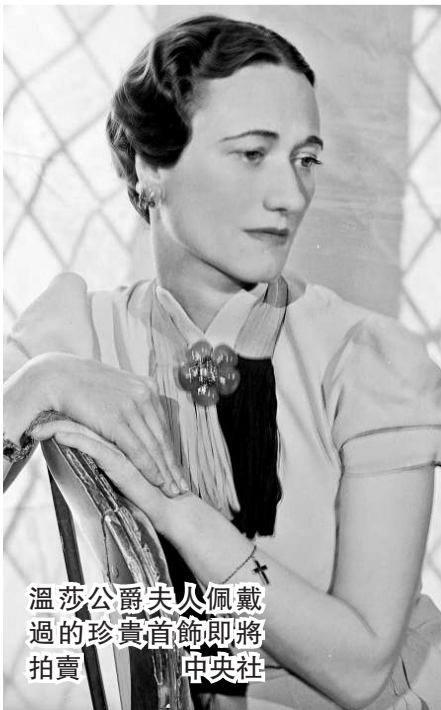
溫莎公爵夫人佩戴過的珍貴首飾即將拍賣