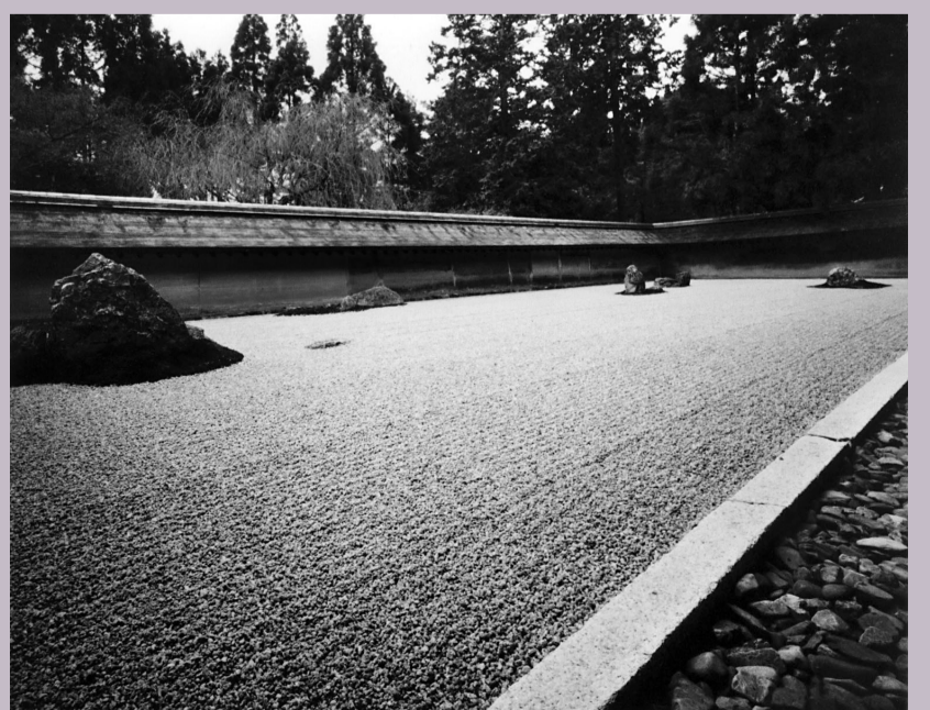
京都龍安寺庭園 579 x 723 毫米

這展覽曾先後在美國、加拿大、法國、馬來西亞、越南、新西蘭、俄羅斯、烏克蘭、土耳其、伊朗和斯里蘭卡等地巡迴展出。