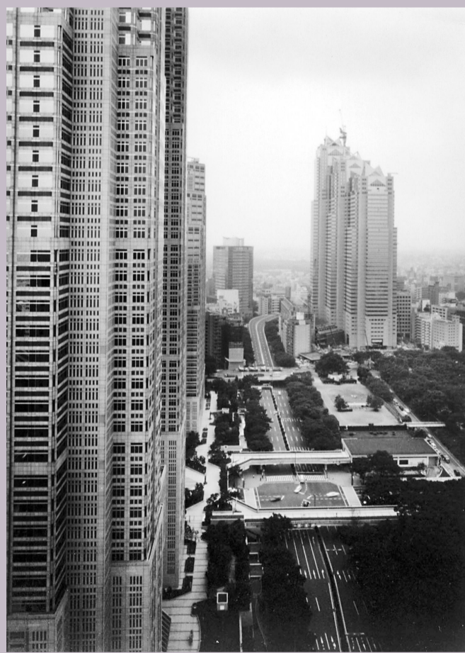
東京新宿區風景 723 x 579 毫米