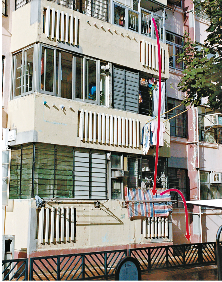
▶男童的母親(右一)被警方拘捕帶署 ◀男童從三樓露台墮樓，撞到一樓單位的晾衫架，再反彈跌落地面(紅線示)