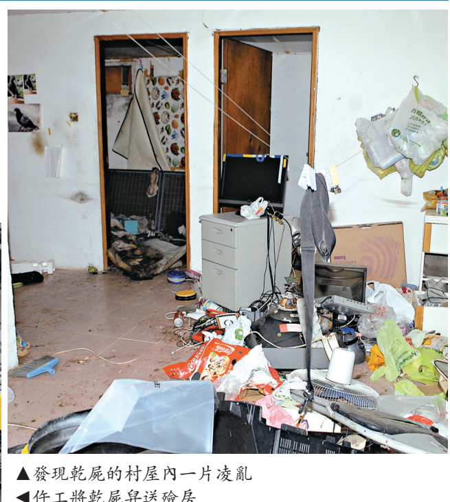
▲發現乾屍的村屋內一片凌亂 ▲作工將乾屍昇送殮房