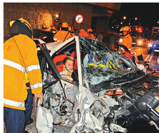
▲消防員拯救被困的私家車司機 ▲大埔道兩私家車相撞現場

沙田大埔道往九龍方向行駛，途至沙田花園對開時疑因路滑突然失控，越過對面行車線與一輛駛至私家車迎頭相撞，車頭嚴重損毀，兩名私家車司機被困車中。 警員趕至先將受傷乘客送院，醫療人員奉召到場協助，消防員用工具將私家車車身撬開，約半小時先後將被困兩名司機救出送院救治。 意外發生後，警方將現場一段路面封鎖，以方便救治及調查工作，交通一度嚴重受阻，稍後警方拖車到場將肇事兩車拖走後，現場交通始回復正常。