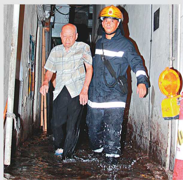
▲消防員協助一名長者疏散

【本報訊】元朗吉慶圍發生縱火燒車案。昨日凌晨一輛泊於空地的七人車，被人淋上易燃物後起火，村民發現後立即救火，消防員到場將火撲熄，調查後認為起火原因有可疑，列作縱火案處理。 昨日凌晨零時許，一輛停泊在元朗錦上路吉慶圍內空地七人私家車，右前輪疑被人淋上易燃物後起火，村民途經發現立即報警及取水撲救，消防員到場開喉迅速將火撲熄，私家車右邊車身熏黑，經調查後認為起火原因有可疑。警方事後向車主了解是否與人結怨遭尋仇，列作縱火案處理。