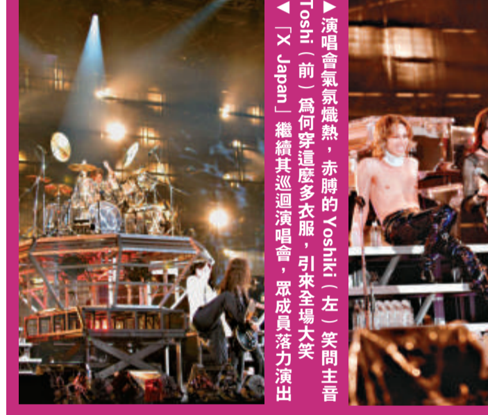
▲演唱會氣氛熾熱，赤膊的 Yoshiki (左) 笑問主音 Toshi (前) 為何穿這套衣服，引來全場大笑 ▶「X Japan」繼續其巡迴演唱會，眾成員活力演出