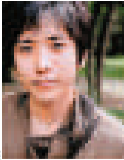
▲二宮和也在新劇演「飛特族」，故事反映社會問題 ▶木村拓哉 (右一) 在相葉雅紀 (左二) 發言時，被指出現不耐煩的表情