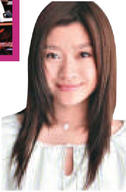
▼篠原涼子婚後五年才補辦婚宴，邀請五十名親友出席

篠原涼子與市村正親早在二〇〇五年結婚，但兩人卻在前日才補辦婚宴，而且婚宴過程保密，甚為低調。日本傳媒報道，婚宴於篠原的老家群馬縣舉行，只招待了約五十名親友。據知篠原的父親最初反對這段婚姻，但最後亦贊成，更說希望看到女兒的婚宴，因此才會在五年後補辦。可是篠原父親最近肝臟出現毛病，約在兩星期前入院，婚宴幾乎要取消，最後父親特別向醫院請了一天假，坐着輪椅赴宴，以圓他看女兒穿婚紗的夢。