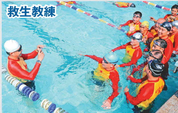
▲福建省紅十字水上安全救生教練訓練班昨在福州開班,來自福建紅十字水上安全志願服務隊和九地市的三十名學員參加訓練,六名來自台灣紅十字組織的水上安全救生高級教練擔任培訓指導

「二〇一〇年京台青年科學家論壇」主要研討農業物聯網發展並展示京台創意農業成果,台灣十餘家農會和北京相關企業共展示了百餘件特色農產品。