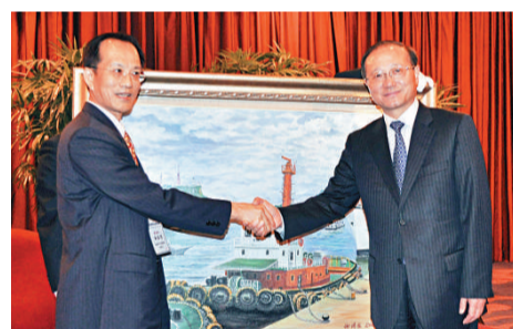
邵琪偉(右)昨在高雄市與高高屏觀光產業聯盟代表會面