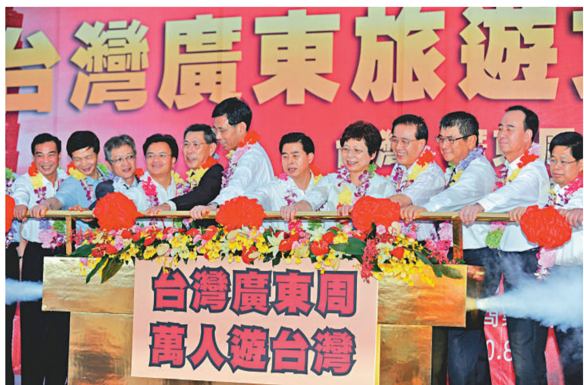
▲廣東省省長黃華華昨率團訪台,在台北啟動「萬人遊台灣」活動

他說,明天「台灣·廣東周」開幕式上,就會有採購簽約儀式,有工業品、原材料、半成品等項目。