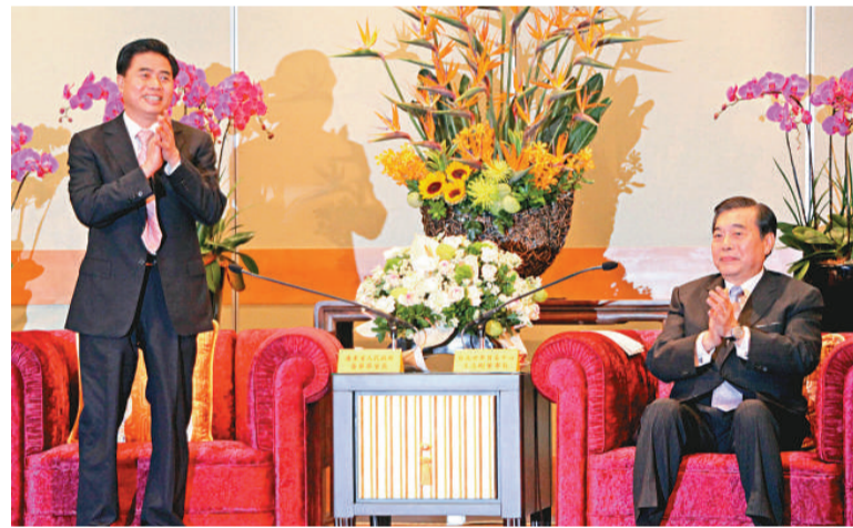
▲廣東省省長黃華華(左)和台灣貿協董事長王志剛在台北國際會議中心會面

到目前為止,廣東吸收台資企業二萬三千八百多家,實際投資金額四百六十九億美元,吸納了六百萬勞工就業;是目前大陸台資企業最多、台資經濟發展最快、對台貿易最活躍的地區之一。