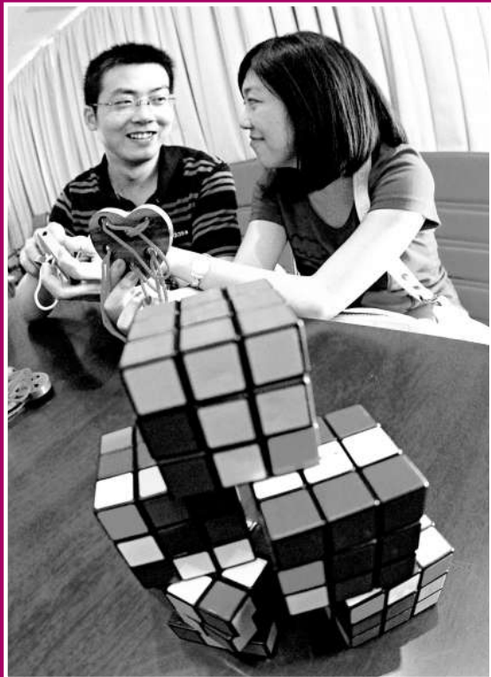
「上海世博園匈牙利館 16 日舉行跳舞、剪紙、玩魔方和心結心等「情侶度七夕」活動。圖為一對情侶在體驗愛心遊戲

上海世博會宛如一個「愛的遊樂場」，不論是陝西館由唐明皇與楊貴妃領銜的「第二屆七夕中華情人節」，還是之前新西蘭館破例為中國新人舉行的婚紗之旅，參觀者在此喊出「愛」與「被愛」的宣言，演繹一幕幕動人至深的「七夕神話」。