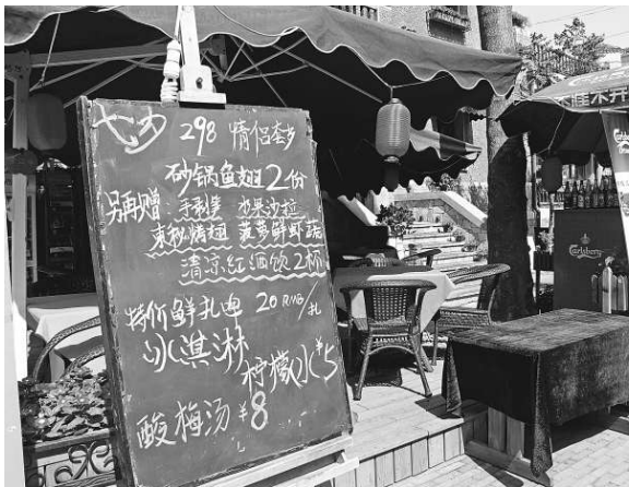
▲天津意大利風情區餐廳裝扮一新，推出「七夕套餐」

馬場道上的「東方樓」是京劇大師馬連良居住過的地方；民族路上的一幢意大利風格的「飲冰室」，是梁啟超的故居；海河東路的一座屋頂尖陡、造型別致的小洋樓，曾是袁世凱夫婦的新婚別墅。一位來自廣西的遊客說，天津「小洋樓」有的精美別致、有的靜穆莊重、有的高聳奇拔、有的富麗纖巧，不同的古典建築風格讓人彷彿置身於異國的街道中。七夕是中國傳統節日，在融入更多歷史內涵的「小洋樓」裡度過這個浪漫的夜晚，實在是再好不過的選擇了。