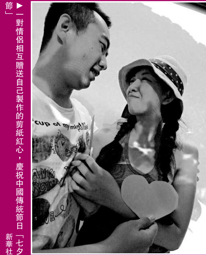
「對情侶相互贈送自己製作的剪紙紅心，慶祝中國傳統節日「七夕」