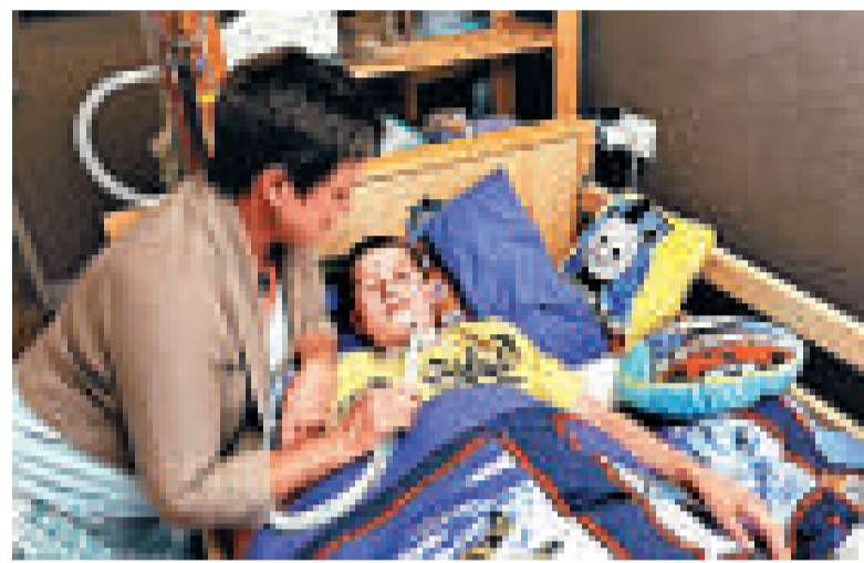
▲德比夏爾患有罕見的肺換氣不足病，每次睡覺都會停止呼吸 互聯網

其後科學家把昏迷的熊媽媽放在籠內，讓3名子女伴隨左右。經過一天觀察後，考慮到牠們一家大小的安全，牠們被送到森林一個比較人煙稀少的地區，自此未再看見牠們的蹤影。（綜合報道）