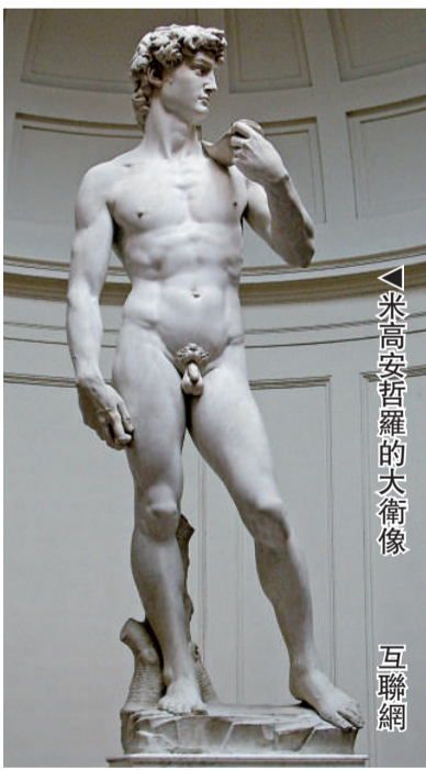
▲米高安哲羅的大衛像 互聯網