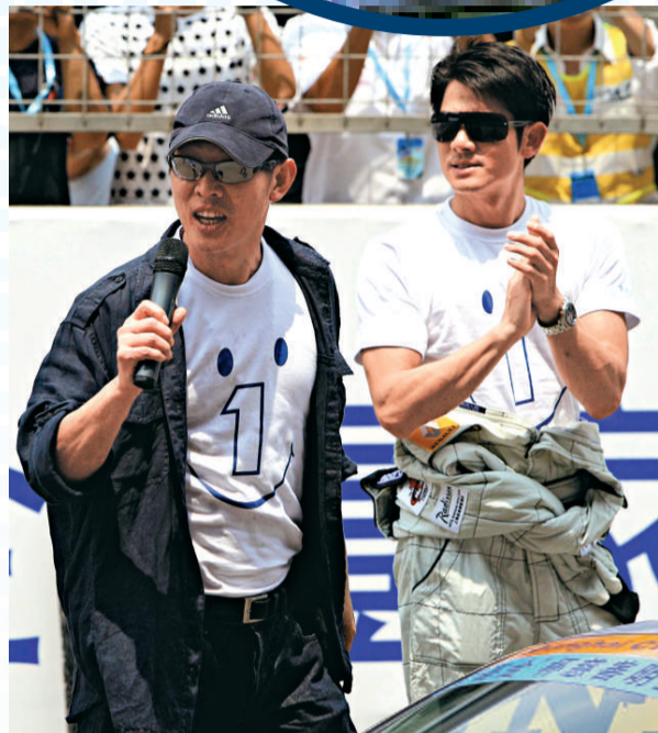
▲劉心悠親吻獎杯 ▲吳家樂勝出令不少人大感意外 ▲李連杰（左）發起籌款活動，郭富城全力支持