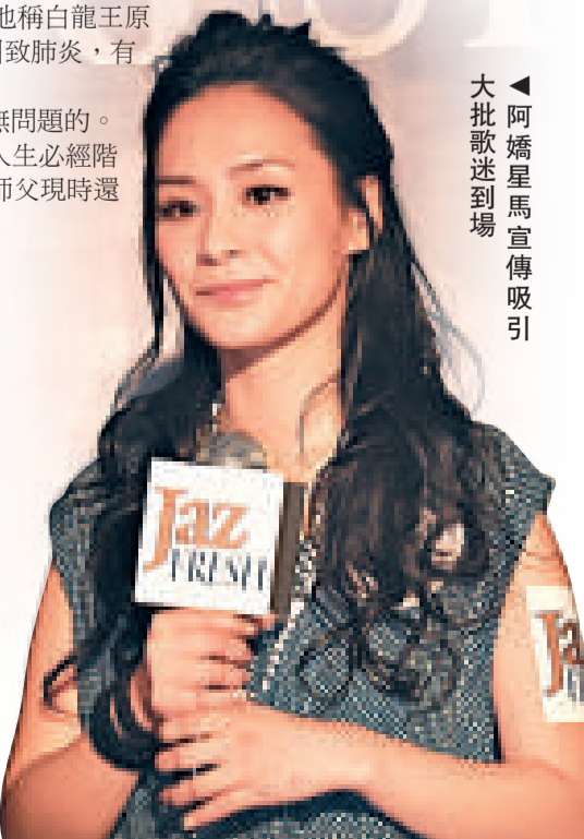
▲阿嬌星馬宣傳吸引大批歌迷到場

阿叻稱白龍王只是肉身有問題，精神是無問題的。而他亦不擔心白龍王的情況，因生老病死是人生必經階段。他之後會否轉為見白龍王的女兒？他說師父現時還在，他亦未與其女兒傾過偈。