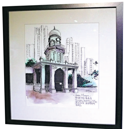
▲《些利街清真寺》以素描的形式來展現