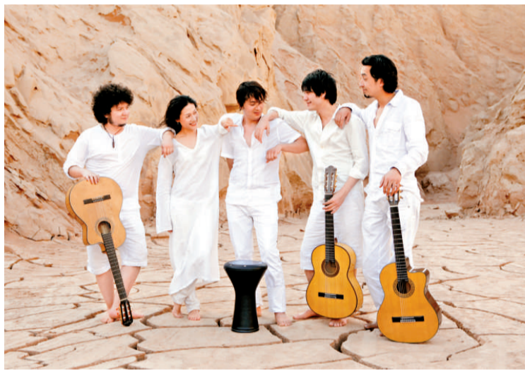
▲木卡姆表演結合香港與新疆的創作人，他們曾一起到新疆採風

「沙·月：維族木卡姆愛情遺歌」將於十一月五、六日晚上八時及十一月七日下午三時在葵青劇院黑盒劇場舉行，門票於城市電腦售票處發售。