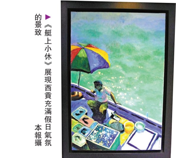
▲《艇上小休》展現西貢充滿假日氣氛的景致

展覽：「Local Colours——本色」油畫與素描作品展 展場：尖沙咀星光行 1523 室 JM Style Furniture and Gallery 展期：即日起至九月三十日 電話：二三七九五九二