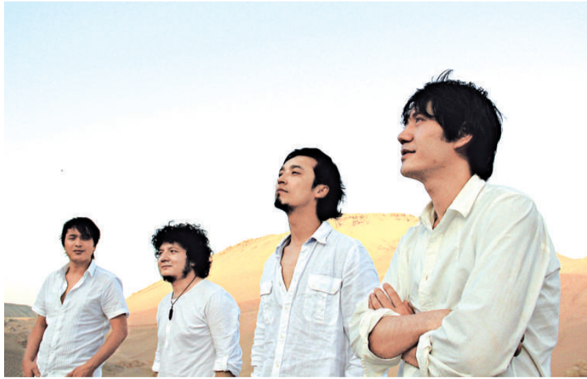
▲JAM樂隊來自新疆，現時常於北京發展