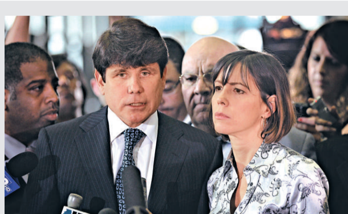
▲美國前伊利諾伊州州長布拉戈耶維奇和他的妻子接受記者提問