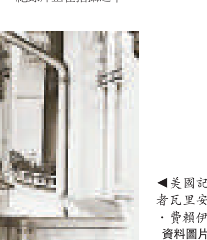
▲美國記者瓦里安·費賴伊資料圖片

1995年被以色列大屠殺紀念館追認為「民族義人」，他是首位獲得這一榮譽的美國人。這一榮譽只授予二戰期間冒生命危險營救猶太人的非猶太人。一部反映費賴伊在馬賽活動情況的紀錄片正在拍攝之中。