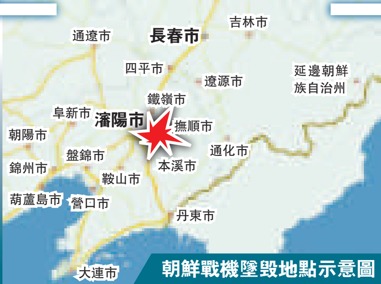
朝鮮戰機墜毀地點示意圖