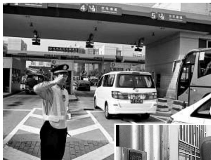
▲近年粵港交往更趨緊密，過境經常大排長龍

與會專家透露，拱北口岸斥資二千五百萬元人民幣在全國首創客車「一站式」電子驗放系統，將海關、邊檢、檢驗檢疫等單位共用一個信息電子平台，司機無需下車填表和提交有關證件，只需簡單地通過指紋和面相識別即可通關，過境受檢時間從原來的兩到四分鐘縮至二十秒。而粵港「單一窗口」通關模式更進一步將兩地跨境口岸的查驗結果參考互認以避免重複查驗，可望再提速一倍以上；並在逐步實現通關數據共享的基礎上，粵港還將重點開展兩地查驗部門之間聯合查驗的可行性研究，屆時「人、貨、車」出入境將有望從目前的「兩地兩檢」全面轉變成「兩地一檢」。