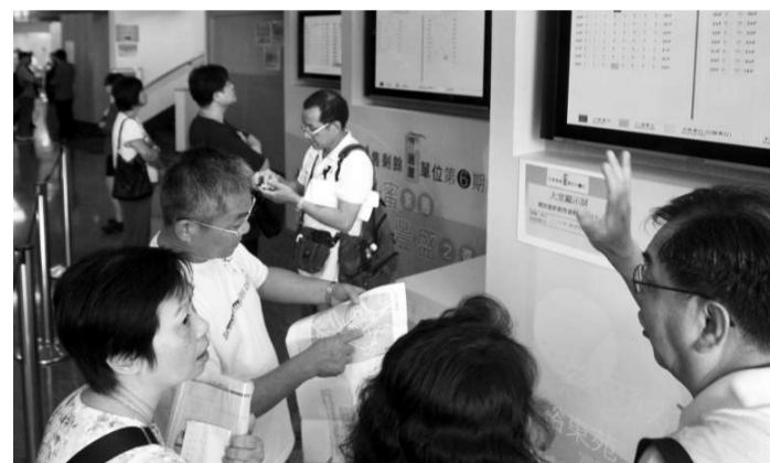
▲前日揀選居屋首日，約有三成準業主「見底」，令一些原來抽籤號碼較後的申請者重燃揀樓希望

前日揀選居屋首日，約有三成準業主「見底」，令一些原來抽籤號碼較後的申請者重燃揀樓希望，昨日前往中心內補回資料，期望可搭上「尾班車」。白表人士何太太表示，現時丈夫需要負擔一家四口的家庭開支，加上需要供樓，預算非常緊絀，因此今次前來揀選居屋。