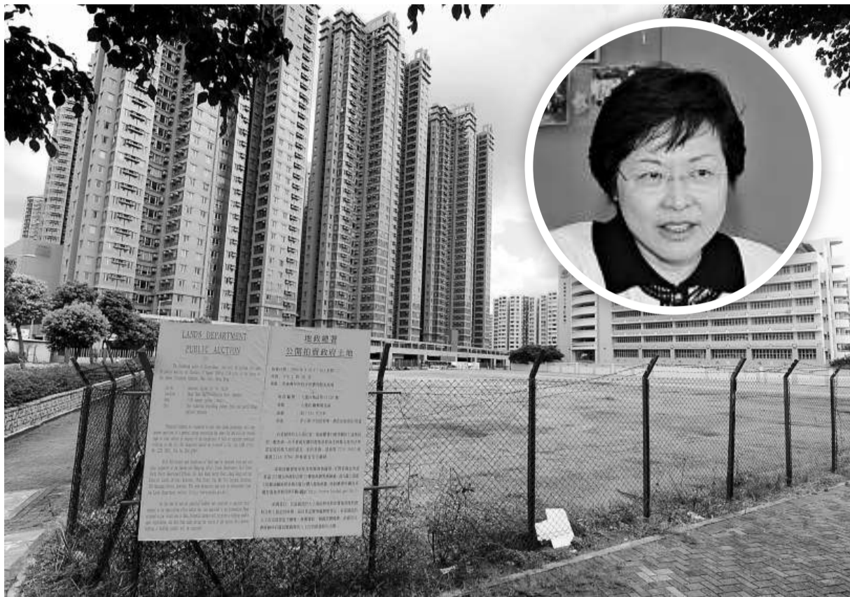
▲林鄭月娥（小圖）稱，有信心下年度土地供應較今年勾地中的九千個單位多

第一大董事總經理陳超國認為，政府應繼續從土地供應方面出招，並向社會清晰表達遠幾年會有多少土地供應用來興建中小型單位。「現時政府不時推出三、兩塊蚊型土地建中小型住宅，根本滿足不了社會的需求。若政府考慮復建居屋，倒不如推出更多土地，規定發展商興建中小型住宅。」香港測量師學會副會長劉詩韻亦建議，政府未來應推出更多適合興建中小型住宅的地皮，以平衡市場需要。