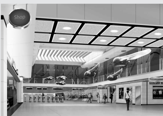
▲旺角東站將化身「大海」，車站天花懸掛藝術品「蜚蚪機群」

旺角東站則化身「大海」，車站天花可以透光，並以藍色作主調，營造海浪感覺；車站天花並掛上由內地藝術家趙光輝設計的藝術品「蜚蚪機群」，由六個行駛中的東鐵線列車為概念，設計成六條巨型蜚蚪裝置，增加車站「大海」的感覺。旺角東站翻新工程將於今年底完成。