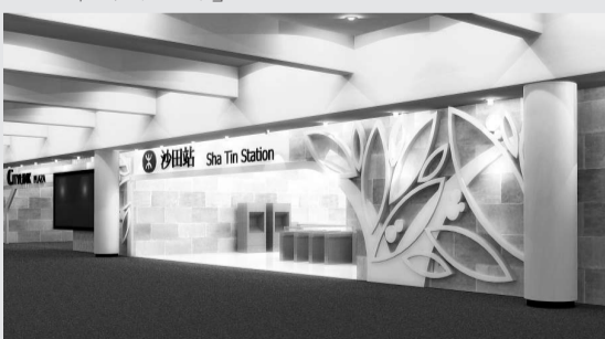
▲沙田站將化身「綠樹林蔭」，其中B出口會採用浮雕設計，刻上樹木花紋裝飾