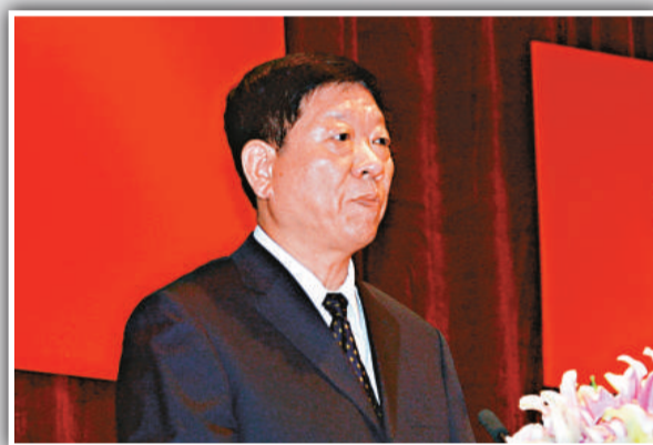
▲尹蔚民代表國務院宣讀表彰決定