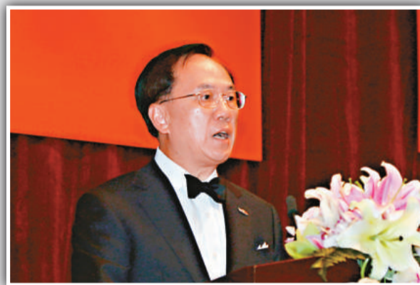
▲曾蔭權表示阿福是香港的光輝榜樣