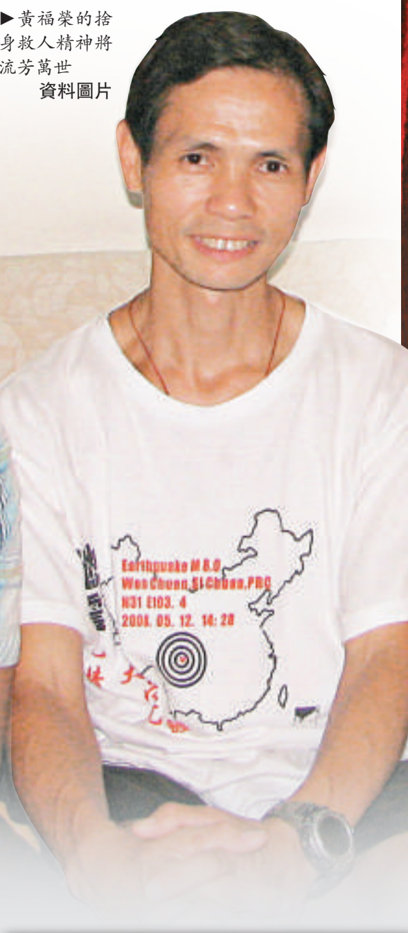
▲黃福榮的捨身救人精神將流芳萬世 資料圖片