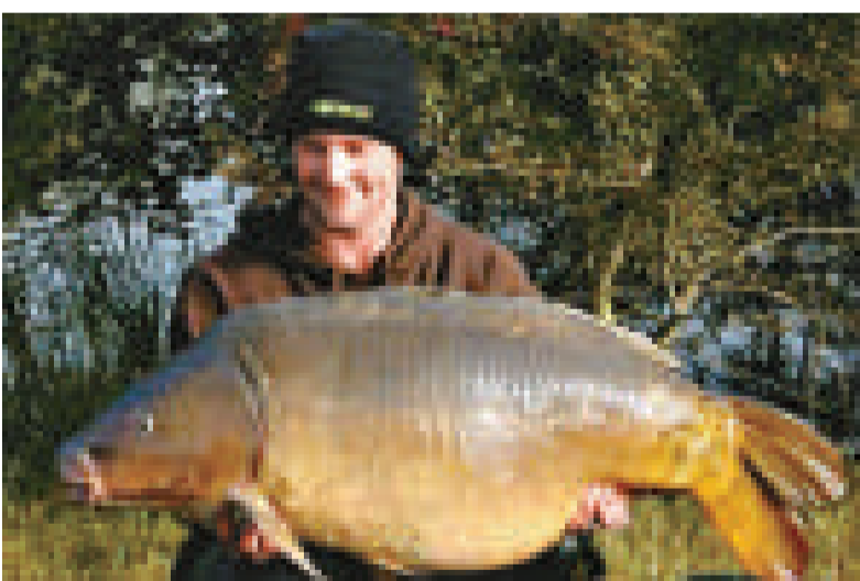
▲全英國最大的鯉魚「雙色」逝世