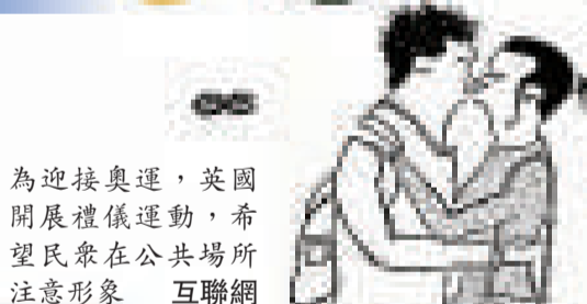
為迎接奧運，英國開展禮儀運動，希望民眾在公共場所注意形象 互聯網

，不要彈手指頭，這可能被視為不禮貌的行為」、「阿拉伯人點了雞蛋，別問他是否要加煙肉」。