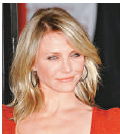
的熱門話題，據此製造出帶病毒的內容。」

邁克菲實驗室網絡安全負責人戴夫·馬克斯說：「他們知道人們想用新名人的圖像做屏保。他們會追蹤網上