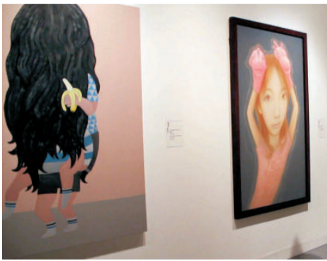
◀潘躍輝《一對布玩偶》（右）、羅美曼《哎，你那根香蕉一點也不輕……No.1》

▶今屆「雙年獎」展出三幅油畫作品：潘躍輝《一對布玩偶》（右起），羅美曼《哎，你那根香蕉一點也不輕……No.1》，卓曉光《淨界》