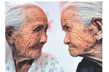
▲日本是高度老齡化的社會，也是長壽之國