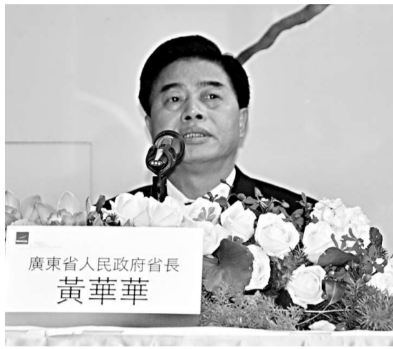
▲廣東省長黃華華 22 日離台前發表感言 中央社

作為本次活動的邀請方和協辦方，台北世貿中心董事長王志剛也在場發表感言。他說，黃華華率領的