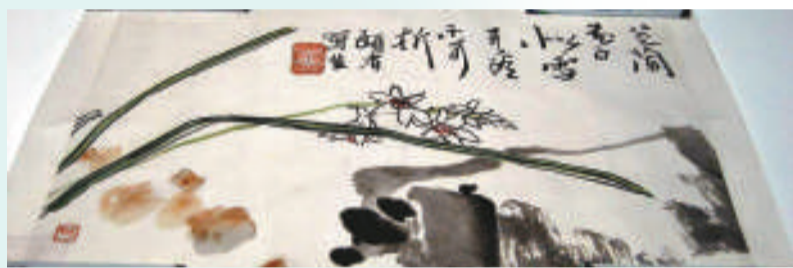
▲《菱蘭花圖》 ▲潘天壽畫作《五鸚鵡圖》 ▲《秋甜圖》