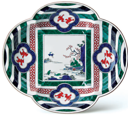
▲中村元風在創作中 ▲中村元風《魚釣圖》 ▲木瓜形大盤