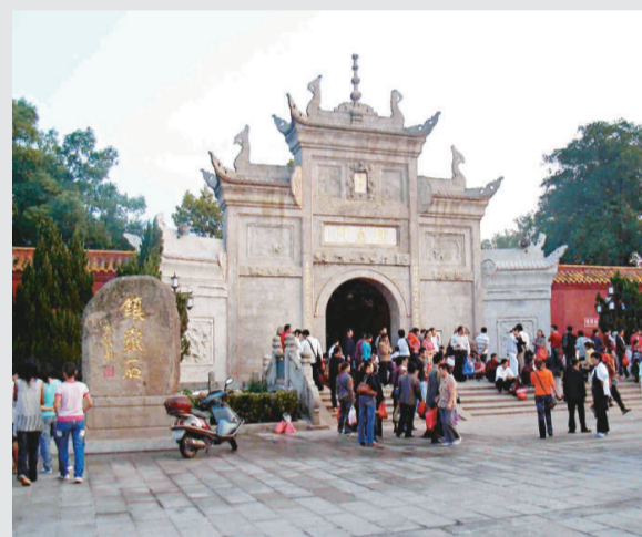
▲南嶽大廟門票調價是因爲「申遺」投入大量資金對古鎮和大廟進行修整。