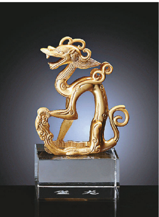
▲銅坐龍是金代皇室御用的祥瑞器物，寓意穩坐天下，其雕塑工藝精湛，藝術造型傳神。

上世紀 90 年代以來，在金中都（今北京）還出土過其他銅坐龍，形制、雕刻都與這尊銅坐龍有所不同。