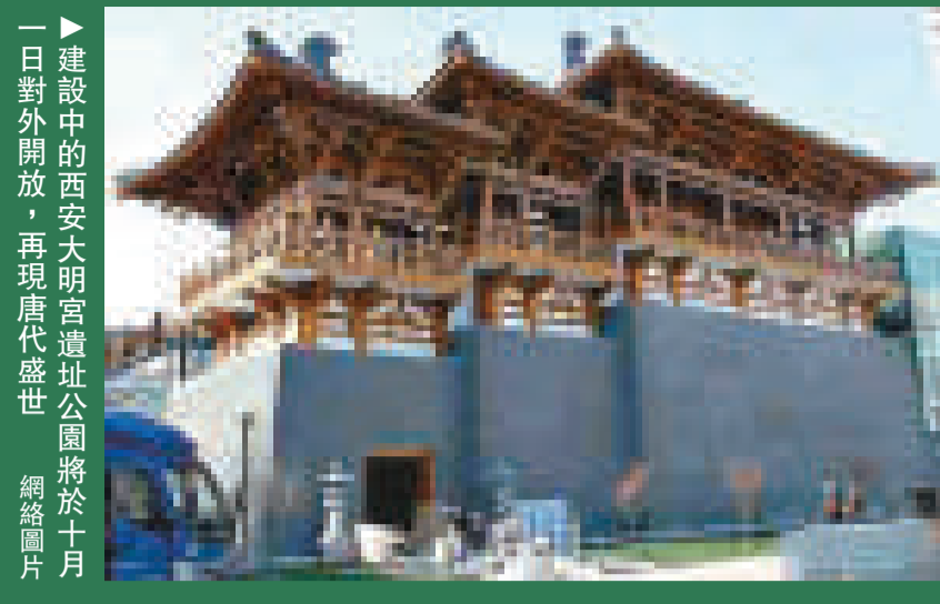
建設中的西安大明宮遺址公園將於十月一日對外開放，再現唐代盛世。