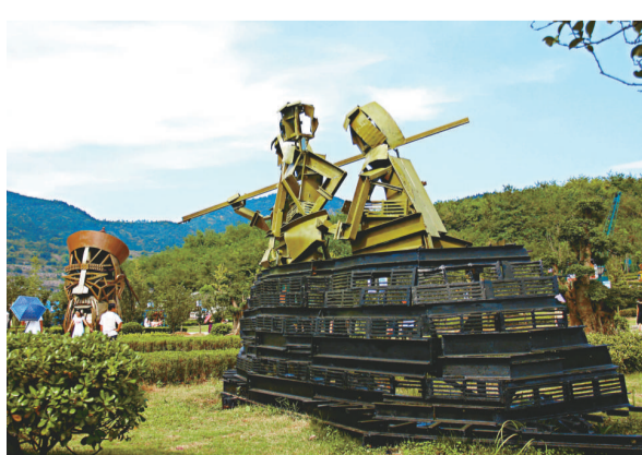
▲礦山公園力揚礦冶文化，隨處可見工業廢料製成的塑像。圖爲「張之洞」與「女地質隊員」。

公園裡，提升機不時緩緩轉動，提起井下開採的鐵礦石，井外擺放的昔日蘇製犁型機、蒸汽機車等，娓娓道出中國近現代礦業的發展歷程；遊人可零距離觀看現代採礦工藝流程，體驗採礦工人勞作，感受百米井下隆隆炮聲，並可乘坐小火車進入「礦冶峽谷」底部，仰望大峽谷。