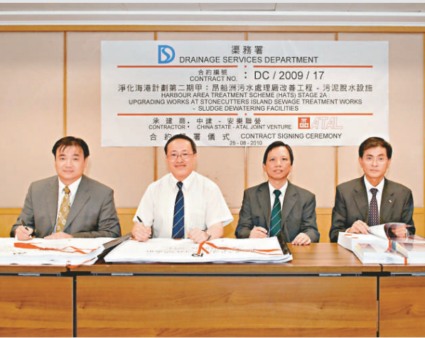
▲渠務署批出淨化海港計劃第二期甲工程合約

【本報訊】香港留日學友會由本月二十三日至二十七日以及八月三十日至九月三日連續兩星期，派專人在香港日本總領事館（中環交易廣場一座四十六樓）設置「日本留學諮詢處」，繼續派發日本留學指南，解答日本留學疑難。查詢電話：2532-2369或2532-2374。