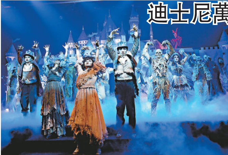
▲「迪士尼黑色世界」即將登場

【本報訊】實習記者陳文怡報道：「萬惡之后」黑巫婆從未獲邀請出席「迪士尼黑色世界」，令她怒氣沸騰。誓言今年將施展魔咒，以黑暗力量籠罩整個香港迪士尼樂園。由九月十六日到十月三十一日，全新的萬聖節之旅將會帶給賓客耳目一新的「迪士尼黑色世界」。