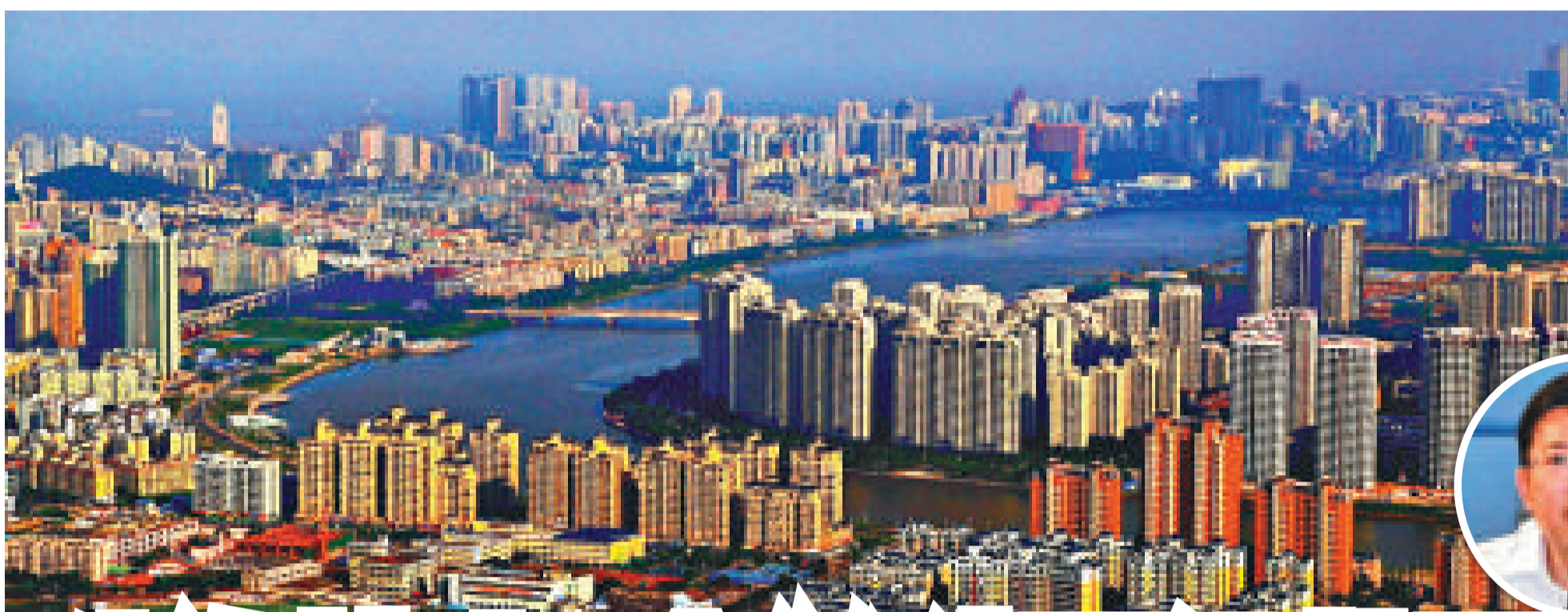
◀ 珠海華發新城全景 陳艷君