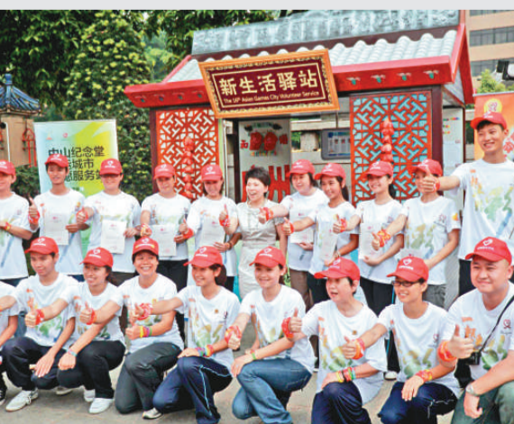
▲廣州將有20多萬志願者服務亞運會

今年以來，廣東省共搗毀傳銷窩點548個，清理遣散傳銷人員4460人次，解救受騙群眾192人，公安機關刑拘、行政拘留傳銷頭目、骨幹分子79人，法院依法判處傳銷犯罪案件39宗、114人，特別是以組織、領導傳銷活動罪查處了一些具有社會影響力的大要案件，如香港亮碧案、世界通案，提升了「打傳」工作的總體效果。