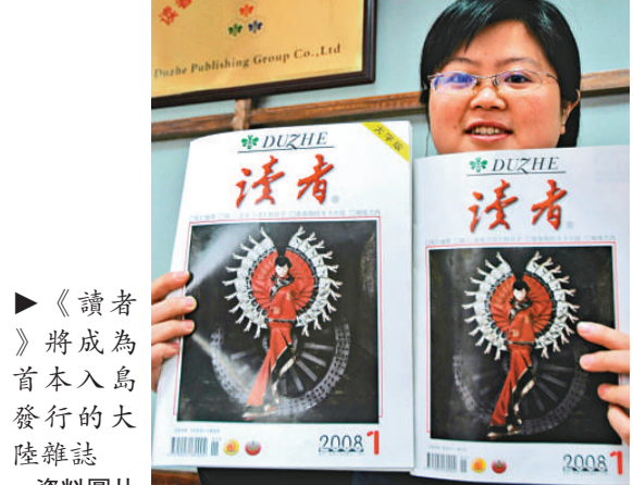
►《讀者》將成為首本入島發行的大陸雜誌。資料圖片

體現人文關懷」，不少兩岸三地的知名作家、優秀文章都曾入選。據了解，《讀者》進入台灣後，將先進入大專研究機構、縣市鄉鎮圖書館，並在便利超商陳售，預估售價約新台幣50元以內。