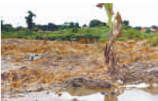
▲倒在珠海小濠沖的垃圾雖經填埋仍臭氣熏天，種在上面遮人耳目的芭蕉也頂不住 網絡圖片

村民們懷疑有「內鬼」協助，據稱，一車垃圾可獲利1000元。當記者致電江門市江海區環衛局，該局