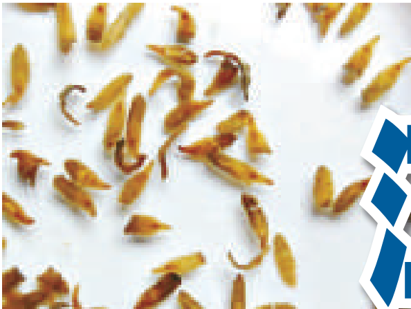
▲顯微鏡下的肝吸蟲 網絡圖片