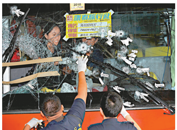
▲旅遊巴士上的子彈痕跡是尋求真相的關鍵線索

今次港人在馬尼拉遇難事件引起七百萬港人高度關注，曾蔭權已取消原定本月二十七至二十九日到福建出席「第六屆泛珠三角區域合作與發展論壇」的行程，留港專心處理今次慘劇的善後工作，改由政制及內地事務局長林瑞麟率領特區政府代表團出席論壇。此外，政務司司長唐英年也決定取消原定本月三十日至九月三日的休假，留港處理有關的善後工作。