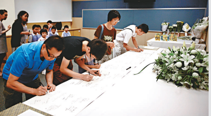
◀連日來有不少市民在吊唁冊上留言 本報攝