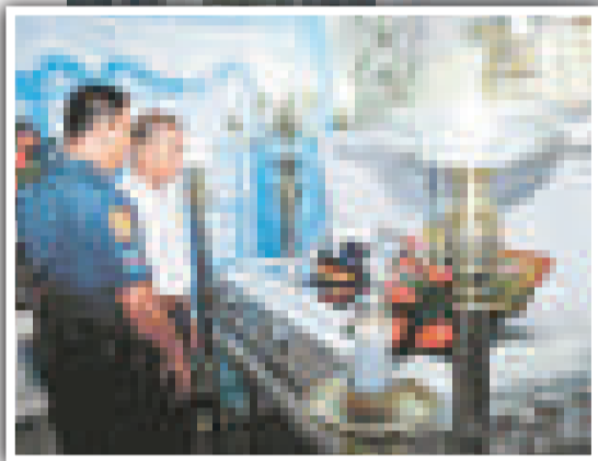
▲在中方作出抗議後，棺木上的旗幟已經移除