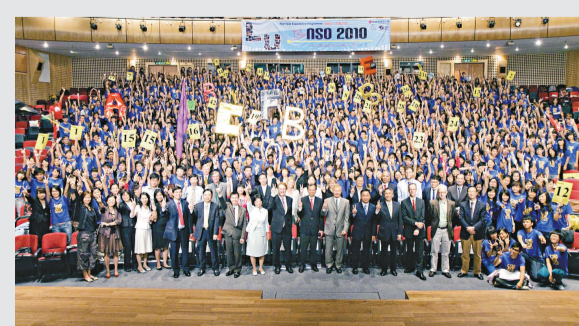
二千四百師生的嶺南大學，近日舉行 2010/2011 年度開學禮，並舉行一連三天的迎新營。校方今年特設體適能項目測試，藉以培養學生運動習慣。