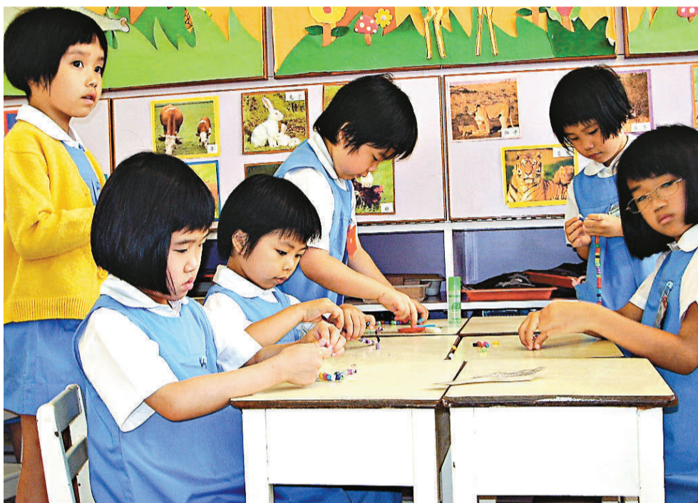
▲加風熾熱，幼稚園學費也不例外，新學年全港有六成三、五百八十八所幼稚園獲准加費，平均加幅為 3.88%