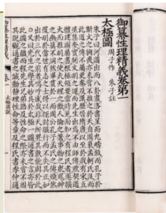
清康熙五十六年內府刊開化紙線裝冊

「染紙」，包括用糖水，或用栗子殼熬水，或用茶水，或用其他方法等將紙染成黃褐色，也有用煙將水熏黃的，以求使紙顯舊色；二類是用「舊紙新印」，如果作偽者存有古紙，就可在紙上面新印古書內容，然後訂成「古籍」，這種作偽方法儘管較少，但卻使人很難從紙張上辨別其為贗本。