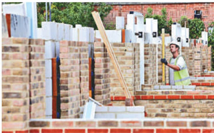
▲英國 9 月房屋價格跌幅為 16 個月最大，估計持續溫和調整。

據英國地產研究機構 Hometrack 表示，英國 9 月房屋價格跌幅為 16 個月最大，估計持續溫和調整。倫敦物業研究所 Hometrack 稱，房屋價格平均跌 0.3% 至 15.82 萬英鎊，此為 2009 年 4 月來最大跌幅。Hometrack 房屋指數是基於受訪的 5100 間地產經紀商調查搜集。該報告同時反映英國房地產市場轉弱，經濟員估計周二公布的數字或顯示，銀行的房屋按揭宗數上月減少。