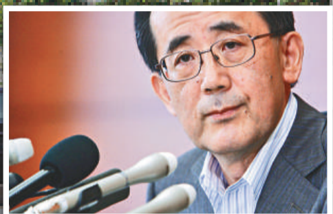
▲日本央行行長白川方明表示，擴大貨幣寬鬆政策，可以有效確保日本經濟復甦。