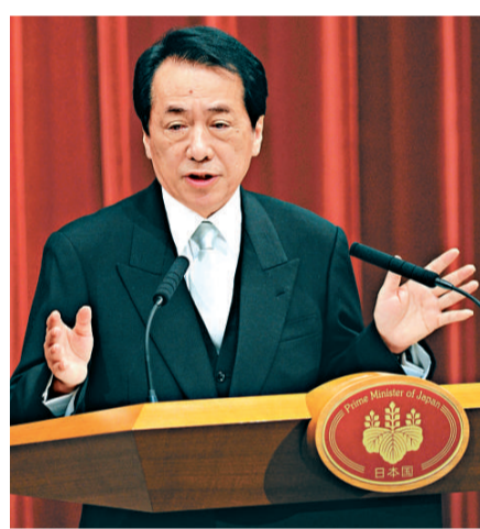
▲日本首相菅直人表示，如有需要，便會制訂一個額外的財政預算案。

同時，日本財政部要求從 2011 年 4 月開始，取得 24.1 億日圓（2840 億美元）的破紀錄融資，來償還債務，反映出該國的公共債務負擔將令財政狀況不穩定。根據日本財務省周一制定的財政預算案顯示，今次要求的還債金額，比去年大幅上升了 17%。