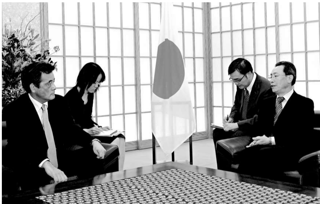
▲中國政府朝鮮半島事務特別代表武大偉(右一)三十一日在東京會見日本外相岡田克也(左一)

二〇〇九年四月，朝鮮宣布退出朝核問題六方會談，並將按原狀恢復已去功能化的核設施。