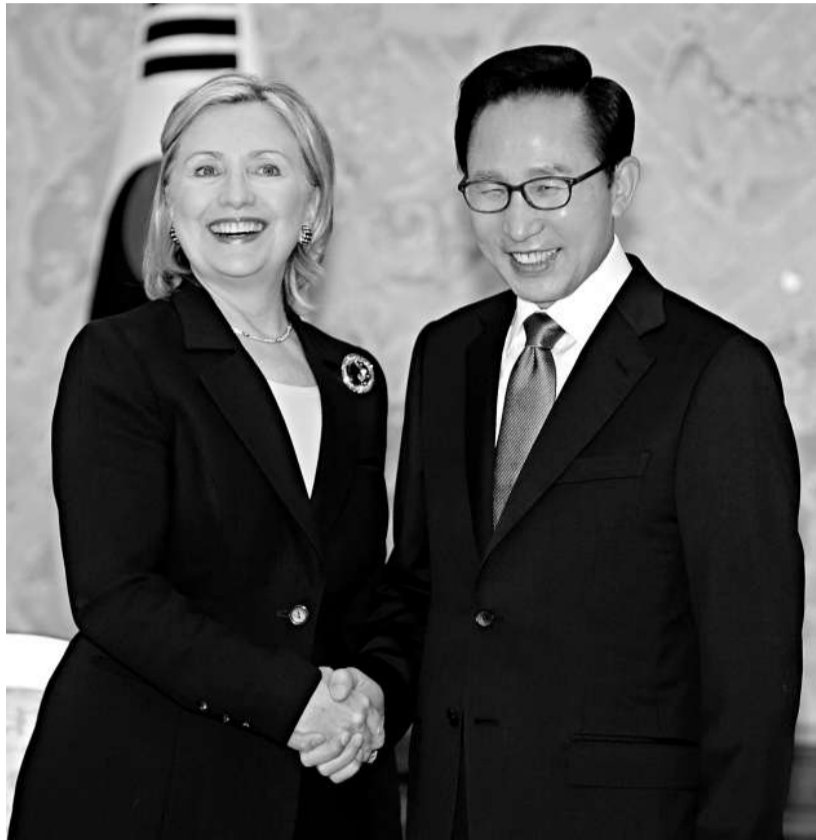
▲韓國總統李明博(右)表示積極評價朝鮮最高領導人金正日訪華。圖為李明博會晤美國國務卿希拉里 資料圖片

【本報訊】新華社首爾三十一日消息：韓國總統李明博三十一日表示，他積極評價朝鮮最高領導人金正日訪華。