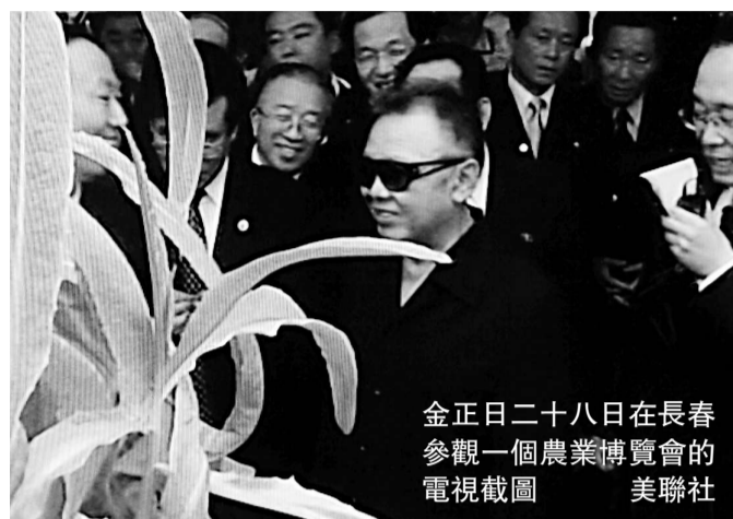
金正日二十八日在長春參觀一個農業博覽會的電視截圖