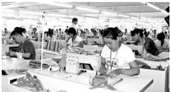
▲東寧縣內的服裝廠已開工生產

東寧經濟開發區已入駐木材、食品、輕工等企業八十餘戶，五十七戶建成投產，實現投資十二億元，成為「哈社經東對俄貿易加工區」的重要節點。服裝鞋帽加工方面，境內已經有十戶企業簽約入駐，順風、金隆昌三戶服裝加工企業建成投產，另外其他行業也均有企業入駐生產。 【本報東寧三十一日電】