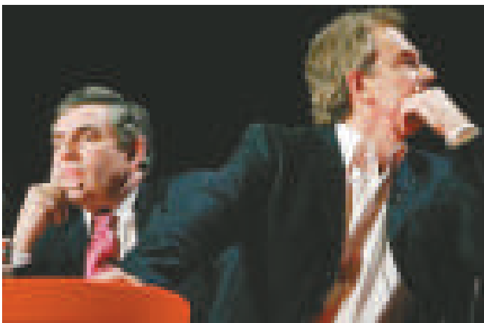
▲貝理雅在回憶錄中毫不留情地批評白高敦（左） 資料圖片

【本報記者黃念斯倫敦一日電】英國前首相貝理雅回憶錄《旅程》1日開始發行。全書記載了貝理雅從1994年任工黨黨魁以來的政治生涯，其中大爆他和繼任人、前任首相白高敦的緊張關係和對方「逼宮」的內幕，狠批對方空有分析和政治計算的能力，但情緒智商（EQ）是「零」，由他來當首相是「災難」，「永遠行不通」。