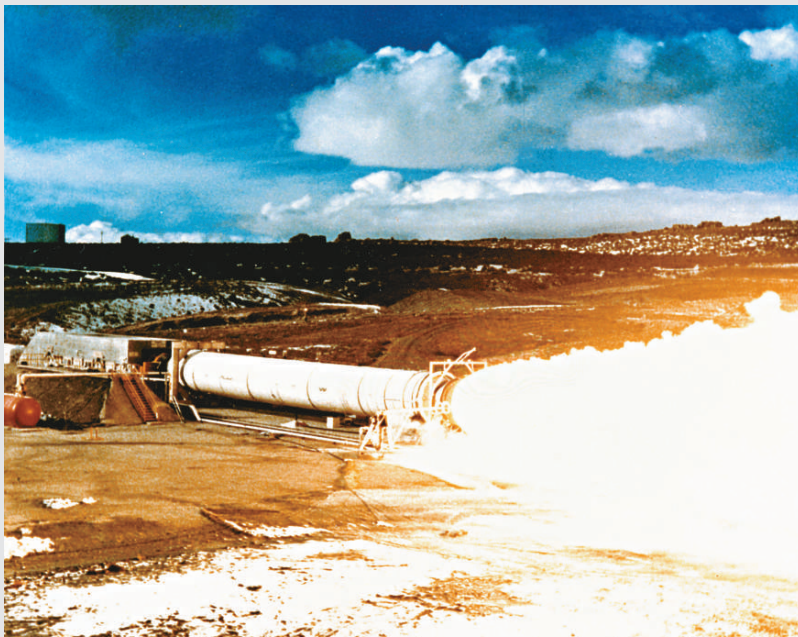
◀美國航天局成功測試了為新一代載人飛船服務的火箭發動機

美國航天局指出，專家還將對這款發動機進行一系列類似測試，檢驗其在4.4至32攝氏度的外部環境下如何工作。依據設計，這種發動機將裝在研發中的美國「戰神」火箭的第一級上，這一火箭將由4個或5個火箭級組成。美國原本計劃用「戰神」火箭發射新一代載人飛船「奧賴恩」，將宇航員送往國際空間站和月球。但按照美國總統奧巴馬今年4月公布的新太空探索計劃，「奧賴恩」飛船將主要作為國際空間站宇航員的逃生飛船使用。