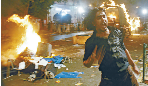
◀在拉合爾爆炸現場，一名男子受驚

【本報訊】綜合外電巴基斯坦·拉合爾1日消息：巴基斯坦城市拉合爾1日發生3起爆炸，造成至少18人喪生，143人受傷，這勢將使正為水災疲於奔命的政府百上加斤。