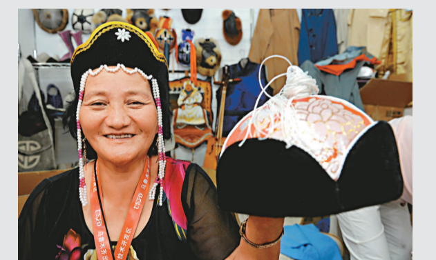
▲蒙古客商在烏洽會上展示特色服飾

國家商務部部長陳德銘說，改革開放以來，新疆經濟快速發展，對內對外開放的新格局初步形成，開放型經濟的作用不斷增強，烏洽會在上世紀90年代初應運而生，迄今已成為我國西北地區規模最大、影響最廣的國際性經貿盛會。按照中央的統一部署，商務部將進一步加大對新疆商務工作的支持力度，積極搭建好新疆對內對外開放的平台，不斷提升烏洽會的層次和水平，努力促進新疆更好更快發展。