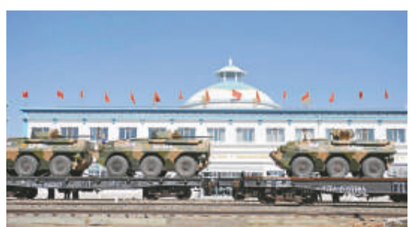
▲參加上海合作組織成員國「和平使命2010」聯合反恐軍事演習的中方陸軍戰鬥群第一梯隊，8月31日從北京軍區某合同戰術訓練基地啟程，前往位於哈薩克斯坦南部的演習地域 中國軍事圖片中心

另據俄羅斯國防部新聞局表示，俄軍將派遣超過1000名官兵，230輛坦克、自行火炮、步兵戰車、運輸車輛以及10架飛機參加此次軍演。