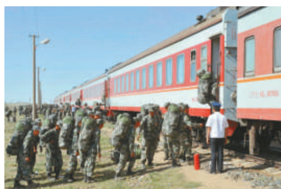
▲首發軍列蒙北啟程