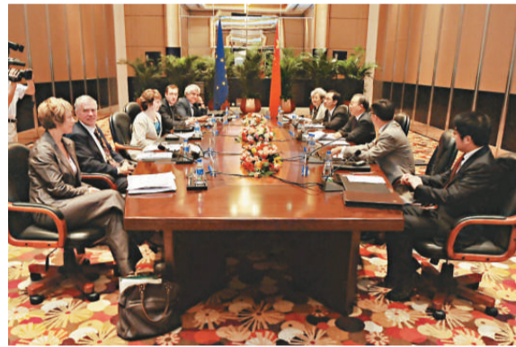
▲中歐戰略對話1日在貴陽舉行

雖然距離貴陽只有50公里距離，但一直較為貧困。代表團成員除了參觀苗寨、了解苗族文化，還走訪了當地的一些貧困戶。