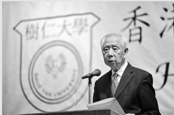
▲胡鴻烈於樹仁大學開學禮致辭

【本報訊】香港樹仁大學昨日舉行兩場新生輔導日開學禮，全校二百多位教職員及近一千三百名新生出席。校監胡鴻烈昨日在開學禮上勉勵各位新生：在四年大學生活最重要是培養自己發展的基礎，也就是自己的修養，以及獲取基本的求學能力。因此，大學的校訓很清楚指出是「敦仁博物」。