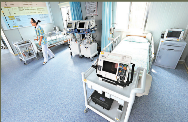
▲南京郊外日遺化武銷毀作業點內中方設置的醫療急救室