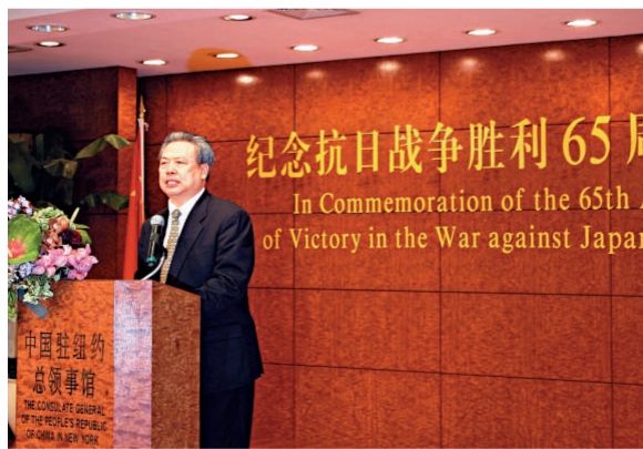
▲中國駐紐約總領事彭克玉在紀念抗戰勝利 65 年招待會上發言

愛好和平與正義的國家和人民、國際組織及各種反法西斯力量的同情和支持分不開的。廣大海外華僑華人，以及台灣同胞、港澳同胞與祖國同呼吸、共命運。彭克玉在講話中還特別提到了美國特別是紐約華僑華人在抗日戰爭中的愛國事跡和英雄壯舉。