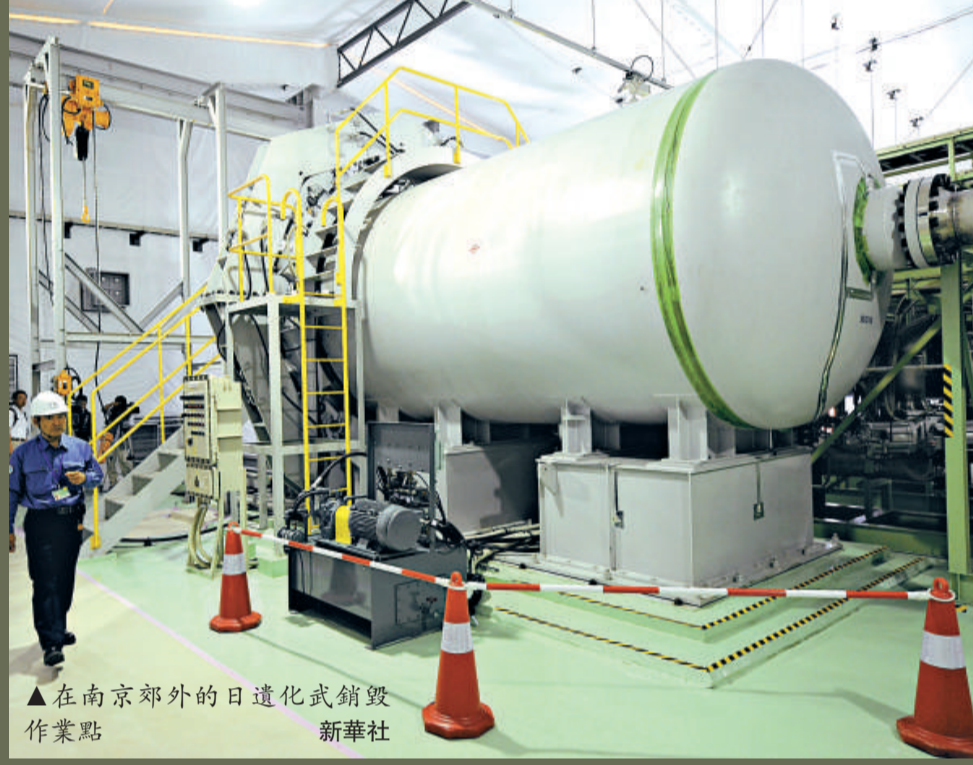
▲在南京郊外的日遺化武銷毀作業點

愛好和平與正義的國家和人民 國際組織及各種反法西斯力量的同情和支持分不開的。廣大海外華僑華人，以及台灣同胞、港澳同胞與祖國同呼吸、共命運。彭克玉在講話中還特別提到了美國特別是紐約華僑華人在抗日戰爭中的愛國事跡和英雄壯舉。